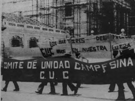
Boeren van de boerenakbond C.U.C. verbergen hun gezicht tijdens een manifestatie. De laatste Guatemalteekse toegelaten betoging is ook al een paar jaartjes oud...

Deze overweging treft niet enkel het Amerikaanse Congres. Een Mexikaanse krant berichtte onlangs de start van de werken aan een eigen wapenfabriek van het Guatemalteekse leger... met Belgische technologie. Tevens doen frekwente geruchten de ronde van de levering van snelle, beweeglijke Zwitserse vliegtuigen, uitgerust met Belgische FN-mitraillettes. Hoe staat het met het mensenrechtenbeleid van onze Belgische regering? Of volstaat het te zeggen dat zij enkel de kleine mis is die ook wat kruimeltjes wil meepikken van het Grote Economische Gebeuren van de Machtige Adelaar? □