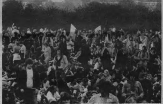
Groenprotest tegen de kweekreactor in Kalkar in de Bondsrepubliek.