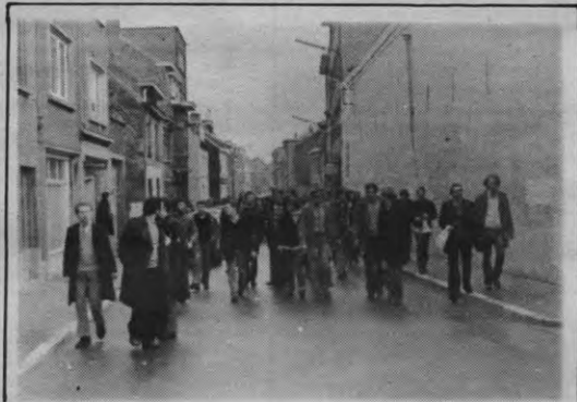
Aktie heren, aktie. Politieke aktie wordt door velen geïnterpreteerd als fysieke aktie. Waardoor prompt allerlei 'alternatieve' — in de breedste zin van het woord — voor de massa in diskrediet worden gebracht. Maar hierbij hebben we ook nog met andere mechanismen te maken. Wie sprak er over media?

Maar er waren verschillen. Ten eerste werd heel de politieke sfeer bepaald door één concreet thema: Leuven Vlaams, tesamen met de strijd