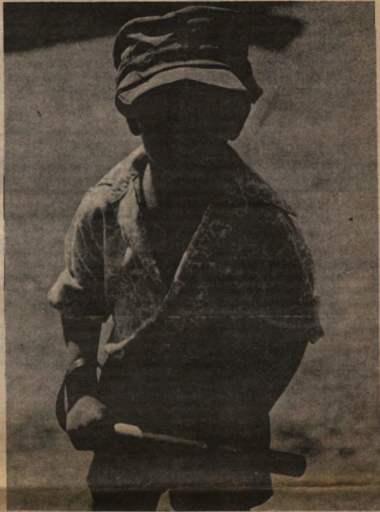
De jeugd zal hard toeslaan als het met de werkloosheid niet snel beter wordt. Ze neemt haar deprimerende lot niet langer. (Uit Jill en Leon Uris' fotobok "Ireland, A Terrible Beauty")

Guatemala is een land dat — eigenaardig genoeg — hier in Europa bitter weinig aan bod is gekomen gedurende de laatste jaren. De problematiek in deze streek werd bijna continu overschaduwd door de gebeurtenissen in El Salvador en Nicaragua, op de verdwijningen van Serge Bertin, Walter Voordeckers en Ward Capiou en de moordpartij bij de bezetting van de Spaanse ambassade in '76 na. Slechts de laatste maanden is hier verandering in gekomen, en dan vooral vanuit kerkelijke hoek. Bij nader toezien blijkt dit gebied immers het proefterrin bij uitstek wat betreft "antiguerillatactieken": verdwijningen, moorden en massamoorden, kortom: onderdrukking volgens een boers recept, gekruid met enkele fines herbes om het geheel wat smakelijker te laten overkomen: individuele hersenspoelingen en massale indoktrinatie.