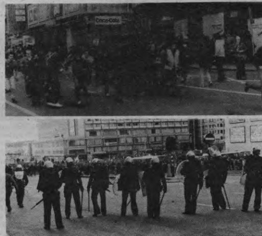
Merk het subtiele verschil: de foto onder toont de Brusselse politie entoesiast op weg naar hun werk, op de foto boven ziet u hoe jongeren verveeld aanschouwen aan het doplokaal. (foto's van de jongerenmars te Brussel op 24 april 1982) (foto's WiV)

Dit eisenplatform vonden wij nogal theoretisch, daarom drongen we erop aan dat de beide mannen zouden toelichten hoe ze zulks zien mogelijk worden. Ze noemden daarbij de prioritaire voorwaarde de werkdijverkorting, die volgens hen op 32 uren kan worden gebracht, zoals een recente UCL-studie hun leert. Zulks zou moeten gepaard gaan met loonsbehoud. Ook zou moeten werk gemaakt worden van de vermogensbelastingen en van de aanpak van de fiscale fraude en de kapitaalvlucht. Dat kan dan weer niet met de huidige wetgeving, die moet daarvoor uitgebreid worden.