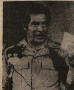
Rios Montt, de recentste "hand-haver van orde, vrede en recht" in Guatemala. Sieg Heil!

Terwijl in Genève de voorbereidende ontwapenings-besprekingen voortboeren, wijd de Westerse Grootmacht nr. 1 rustig in zijn achtertuin. Centraal-Amerika is sinds jaar en dag het lastige hoekje, vergeven van het onkruid, waar de US blijkbaar zelfs met zijn beste en duurste herbiciden geen blijf mee weet. De bananen van de United Fruit Company zijn in gevaar, ze worden aange-tast door een gevaarlijke worm die "verzet" heet. Slechts weinige middelen kunnen hier tegen baten: Geheim Antikommunistisch leger, Witte Hand, Escadron van de Dood. In Centraal Amerika is een genicidie bezig en het urgentiepunt is Guatemala.