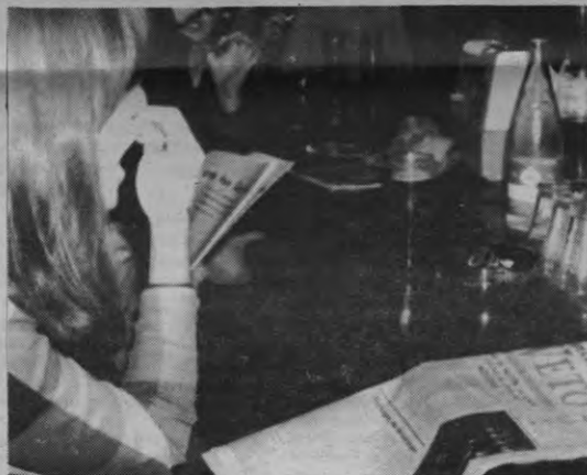
Wein, Weib und Gezag... gekombineerd met een politiek artikel in een bekend Leuvense tijdschrift. Twee schijnbaar tegengestelde zaken vullen het studentenbestaan.

In een overtuiging ligt inderdaad nog steeds meer kracht dan in een studentenorganisatie. Maar hun belang mag niet onderschat worden: ze kunnen gemakkelijk deze overtuigingen tot de hune maken. Daarom is het gevaar-