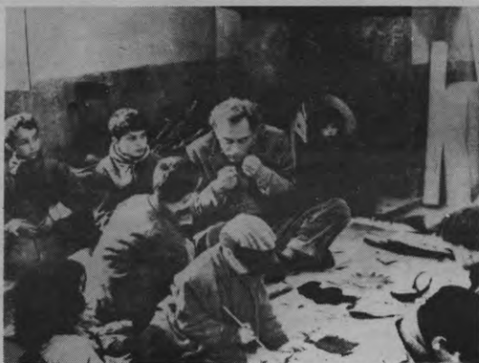
Kristus wonderwel niet aan het kruis. Binnenkort misschien wel op de bus. Rara. Weér een filmartikel.

lijke omgang, tradities en onwetendheid die vooruitgang belemmeren.