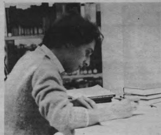
Eén blokkende student? Neen, zomaar eventjes 20000 blokkende studenten in onze dierbare universiteitsstad. Geen tijd meer voor politiek?

lijk dat er een nauwe band bestaat tussen ekstreem rechtse groeperingen, zoals TAK en NSV, en hun meer gematigde kollega's, zoals het KVHV. Terwijl links verdeeld op zoek is naar alternatieven, ontstaat er een machtsvacuum, op de ASR bijv., dat de