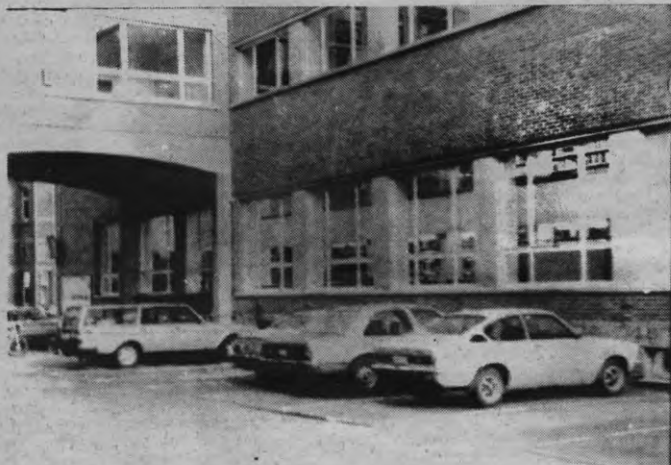
Sociale wetenschappen houdt grote kuis in haar bibliotheek. Besparen op tijdschriften lijkt wel een zware hypoteek te leggen op deze fakulteit. Is de toestand daar binnenkort even mottig als het gebouw eruit ziet?