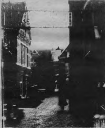
De troise burch der philosophia is gebouwd in de zalige tijd dat er nog geld was... Ook op de 'wijsheid' moet nu ingebonden worden.

Hoe dan ook, dit is weinig verantwoord. Hoewel het niet verstandig is om elk bijkomend ambt te verbieden voor professoren (om velerlei