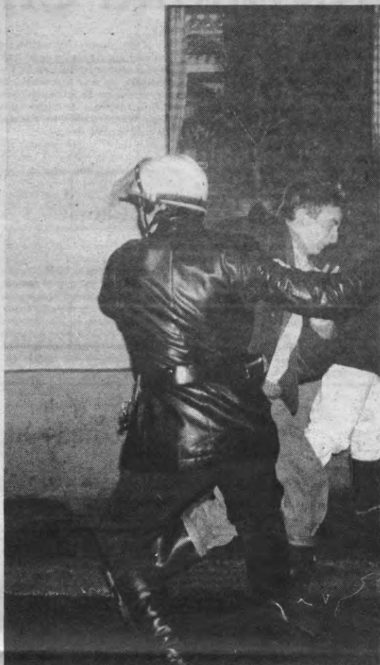
... Maar er waren ook harde momenten.

Op verzoek van de gerant (?) werden de menottes weer afgedaan. Terwijl buiten het gejoel zich verwijderde en de fichier van de rijkswacht