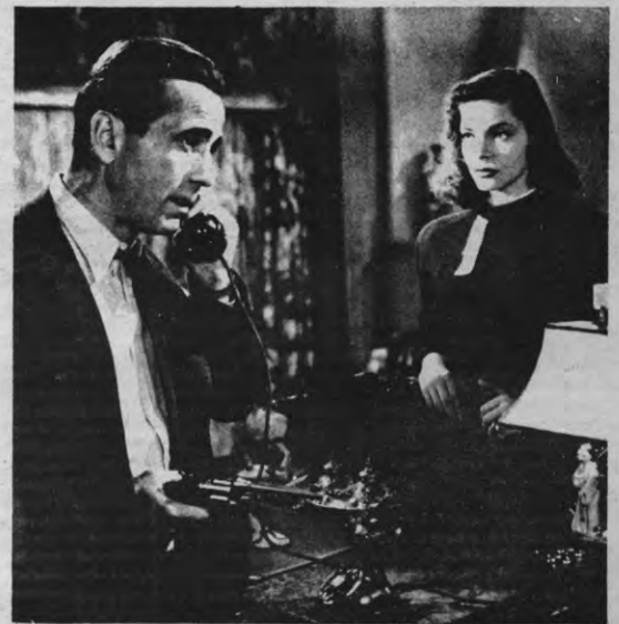
Humphrey Bogart en Lauren Bacall in «the Big Sleep».