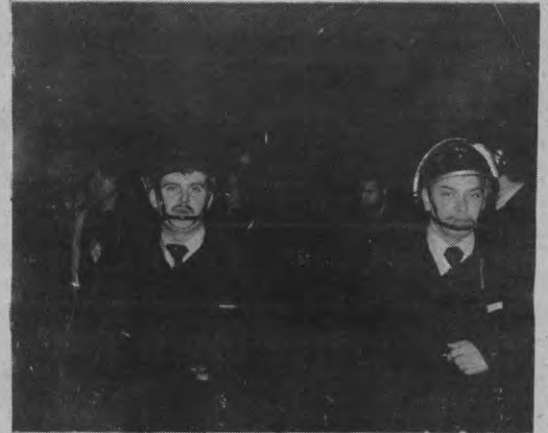
Een (duistere) aktiefoto net voor onze verslaggever nader kennismaakte...

Er kwamen uiteindelijk toch wat mensen opdagen, zowel uit het Begijnhof als uit de richting van de Thierbrau. Maar niemand wist blijkbaar wat er te gebeuren stond. Sommigen waren zelfs gekomen omdat ze rijkswachters in Leuven hadden opgemerkt. Ja, zelfs onze vrienden van het KVHV kwamen voorbijgekuierd... en gingen een gezellig onderonsje houden met de reeds vernoemde BOB-ers. Ook ik liep richting BOB, wou een praatje maken, maar dat was zo te zien niet naar de heren hun schik. Flarden van een stem uit de mobilfoon: "Zeg, die 25 man die je daarnet hebt gemeld, gebeurt daar nog iets?"