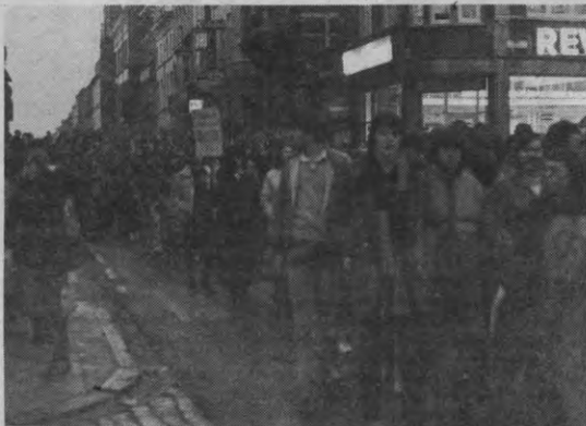
een vredig beeld van de betoging...