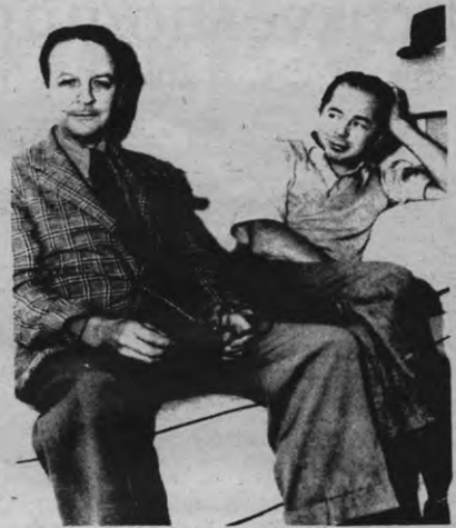
Raymond Chandler (l) en Billy Wilder (r).

RKO Pictures verfilmde Farewell, My Lovely twee keer. De eerste versie werd uitgebracht onder de titel The Falcon takes over (om in te haken op het financieel succes van The Maltese Falcon ) en de tweede versie heette Murder, My Sweet . In 1942 bracht Twentieth Century Fox The High Window uit als Time to Kill en Warner Brothers verfilmde The Big Sleep naar een scenario van William Faulkner en Leigh Brackett en met Humphrey Bogart (als Marlowe) en Lauren Bacall in de hoofdrollen. In 1943 werd Chandler gevraagd om samen te werken met Billy Wilder aan het scenario voor de verfilming van James M. Cains Double Indemnity , het verhaal van een vrouw die samen met haar verzekeringsagent een plan beraamt om van haar man af te komen zodat ze de verzekeringspremie zouden kunnen opstrijken. Het scenario kreeg een nominatie voor een Academy Award, en meteen had Chandler in Hollywood naam gemaakt als scenarist. Van toen af heeft hij nog meegewerkt aan tientallen andere scenario's, zowel