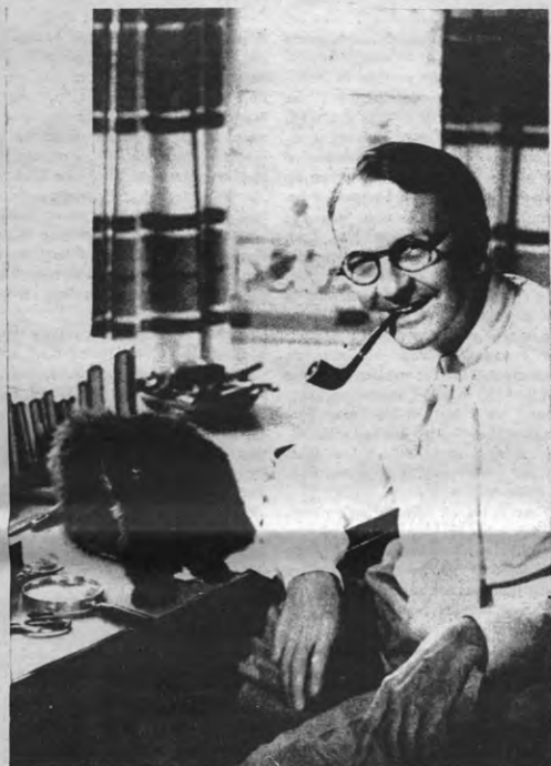
Raymond Chandler en z'n kat Taki.

werd aangevuld werd binnenin op het buitengezet," aldus de vice-rektor, herstelde gezag geklonken. "Eigenlijk hadden we jullie 1 uur eerder verwacht..."