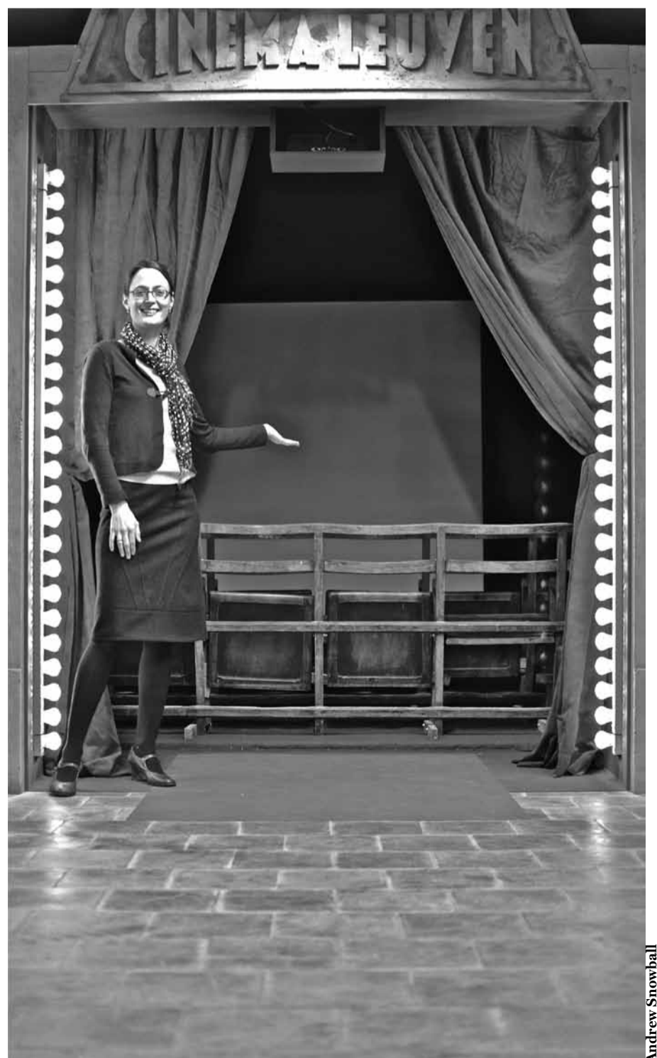
Filmhistorica Leen Engelen

deze tentoonstelling een extra artistieke dimensie. Eigenlijk stellen wij werken van Magritte tentoon.”