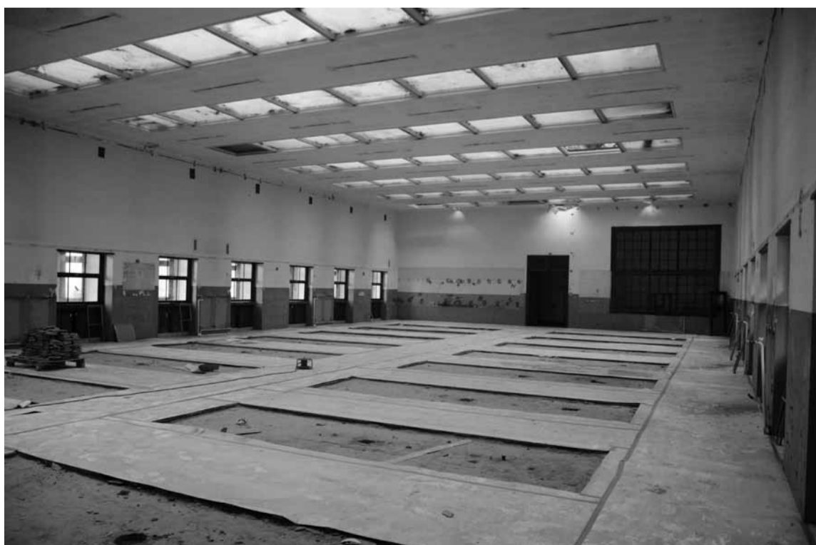
Thomas Van Oppens

Sommigen aanzien het project als niet meer dan een prestige-project. Iets wat Ruben nuanceert: "Het is een prestige-project, en we moeten dat ook zo presenteren om fondsen te verwerven, maar het is niet zo dat het andere belangrijke zaken opzij zet. Zo worden met dit project bijvoorbeeld ook weer andere dingen onderzocht, zoals een online, digitale boekencollectie"