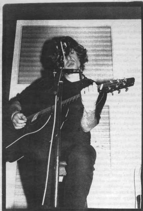
In de wandelgangen van Politika: "Dit lijkt wel fel op de Scabs, vindt ge niet?"