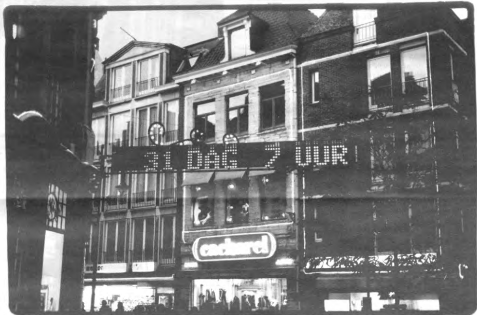
In den hemel zijn der wijven, in den hemel is er drank

En wat met het verouderde pc'tje van de gemiddelde student? Moet dat ook aangepast worden? Professor De Backer: "Het klokje dat in de hardware van de PC zit, is meestal niet aangepast. Dat zal normaal weinig problemen geven. Maar die klok wordt ook gelezen door bios, een program-