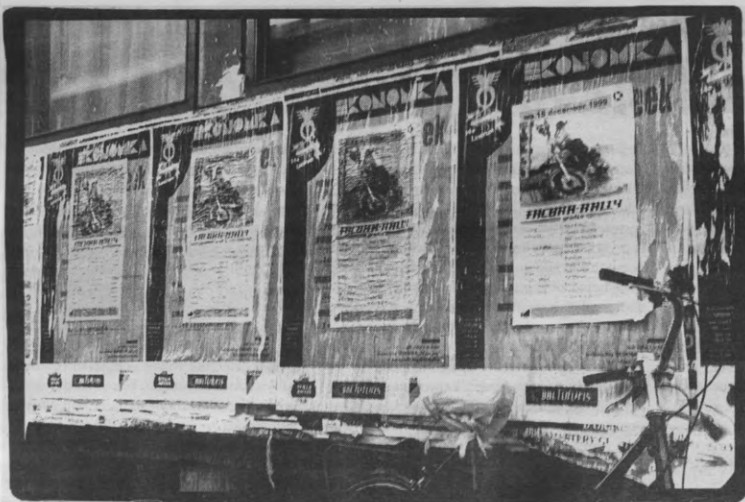
Redenen genoeg om te blijven plakken op Kura's Fakbarrally. Wie niet horen wil ...