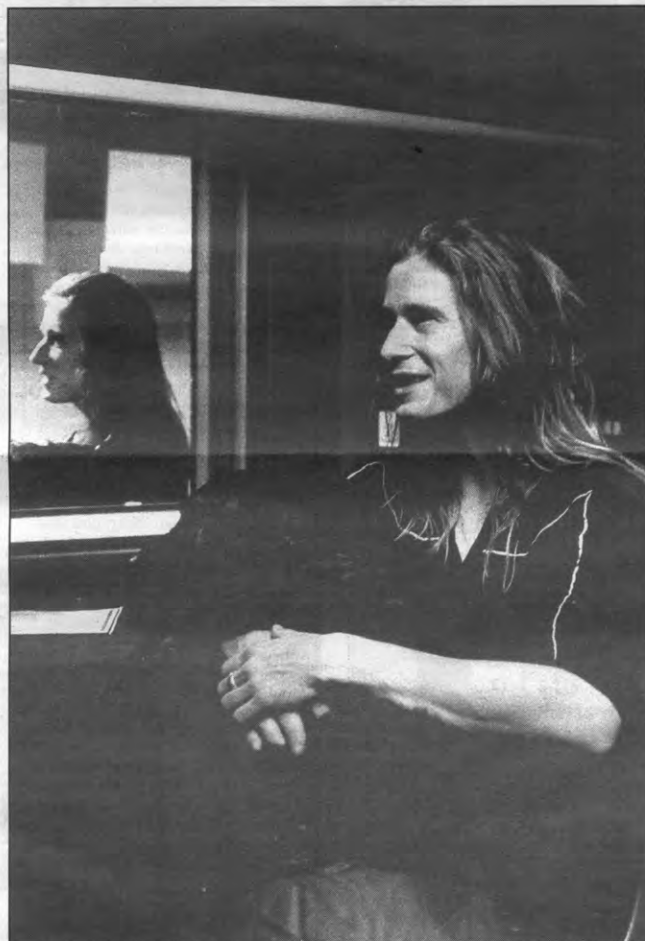
Hey jood, zij de gij ook lid van de Zamu?