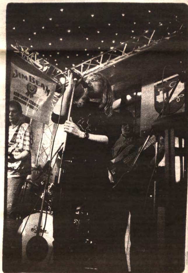
De fakbarrally, het stikt er van de seksuele delinkwenten. België maakt amper geld vrij voor hun behandeling. Het recidivegevaar is dus zeer groot. Lees de middelpunt