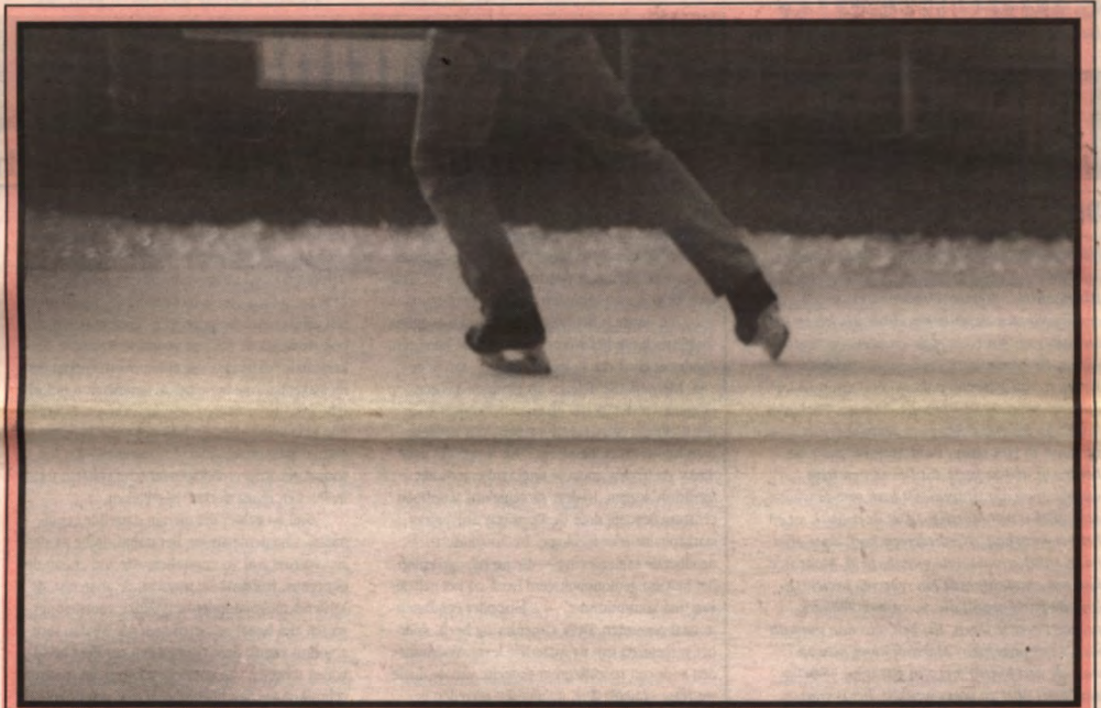
Ook 1997 behoort tot één van de vijf warmste jaren sinds de metingen. Schaatsen in de winter wordt onmogelijk, de aarde warmt op! El Niño zorgt komend jaar voor stormen, overstromingen en orkanen, je merkt het al een beetje. En toch wordt 1998 een fantastisch jaar. Het beste, vanwege de hele Veto-ploeg.

Uitlenopende vaststellingen hebben de verschillende organisaties en de parlementsleden ertoe aangezet om het systeem van studiebeurzen te verbeteren. Zo is het aantal beursgerechtigde studenten en het totaal bedrag voor de studiebeurzen de laatste jaren sterk gedaald. Sinds 1989 daalde het aantal beursstudenten aan de universiteiten van twee-entwintig naar vijf-