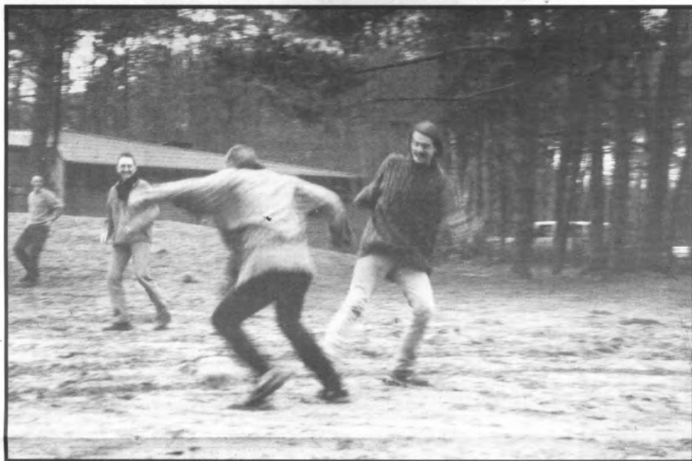
Spelers met wereldklasse worden alleen maar beter van hoge transferbedragen

Veto: Is het aan de Belgische Voetbalbond om iets te ondernemen tegen de wantoestanden die — volgens u — in de marge van het voetbal —