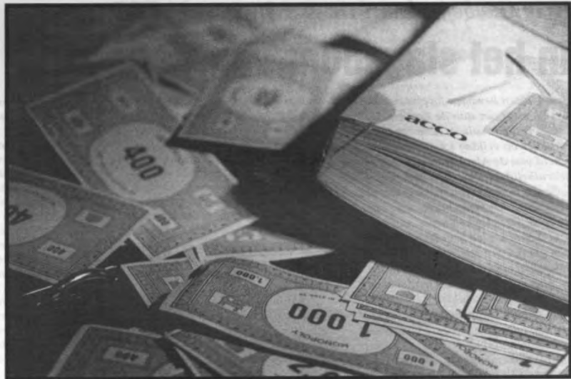
Hervorming studiebeurzenstelsel noodzakelijk