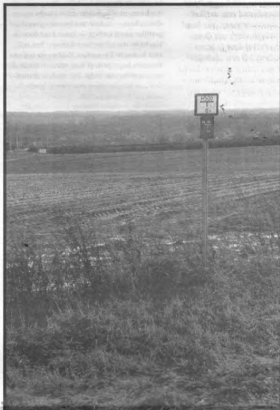
En 'k heb eens patatten geplamt

(...) De politici weten wel dat rationalisering een noodzaak is, maar ze denken aan het eigenbelang; heb ik een uniek in mijn achtertuin, dan wordt de ekonomie daar beter van. In het Californische Silicon Valley staat elk bedrijf verder van de universiteiten van Berkeley of Stanford af dan iedere Belgische onderneming van de KU Leuven verwijderd ligt. Wij werken samen met bedrijven in heel België en Europa. Met de moderne telekommunikatie verloopt dat probleemloos."