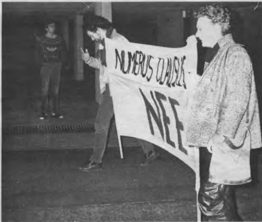
De rest van de betogers lag er helaas reeds uit.

Daarom verschijnt vanaf deze week 'Dossier Numerus Clausus': een met realia gestaafe visie waarom NC onaanvaardbaar is - ook niet in geneeskunde. Inleidend geven we een historisch overzicht van de discussie rond NC in België, en spitsen ons toe op de enige universitaire studierichting met ingangsexamen: Toegepaste Wetenschappen.