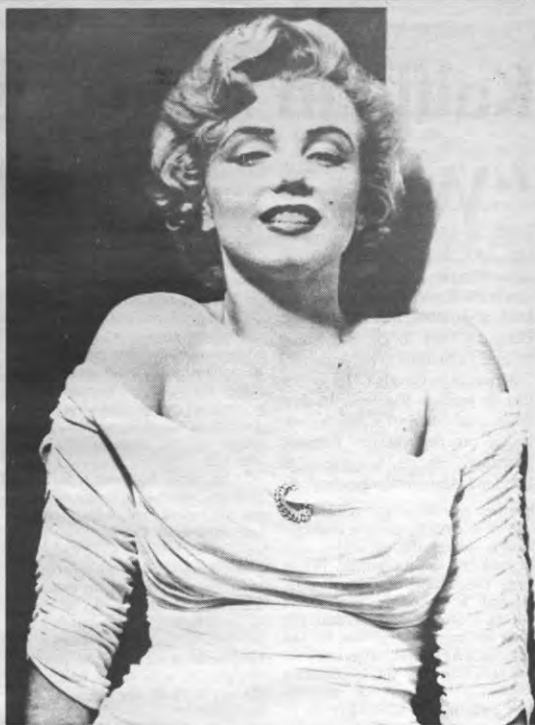
Valse facturen gevonden op lichaam liberale studente.

Naarstige opvolging van het Plan Dillemans