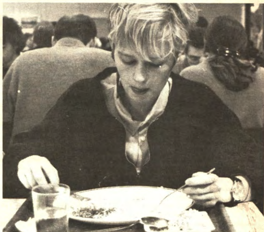
Snij, weer niets in de pap te brokken.

Men gaat ervan uit dat, om de studenten warm te maken voor de Almaproblematiek, eerst een bredere informatiecampagne moet opgestart wor-