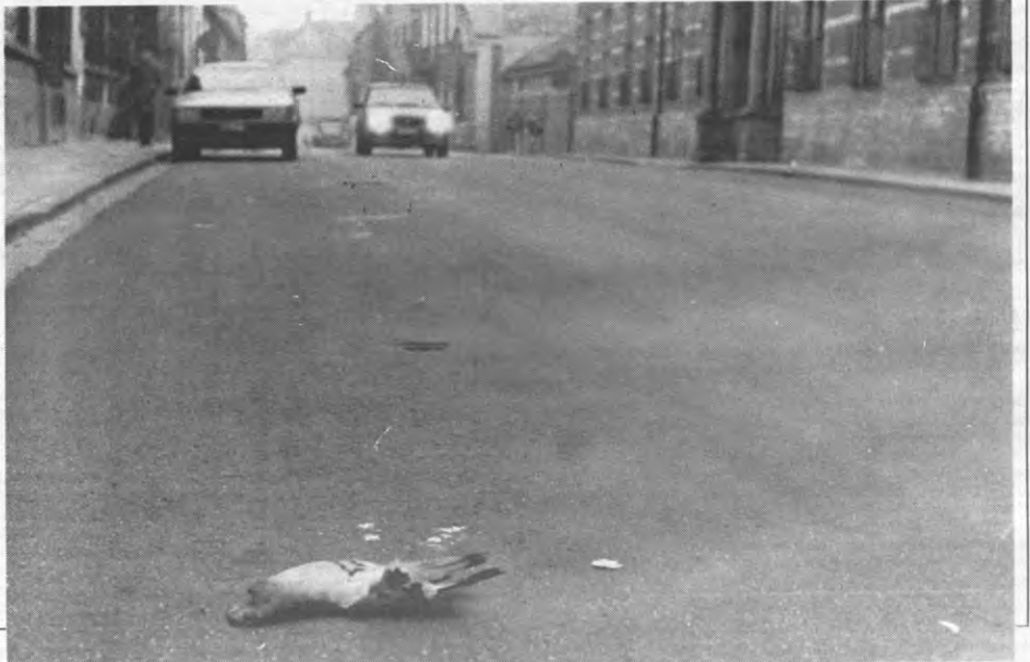
Getuigen van dit ongeval, zich melden bij de duivenbond.