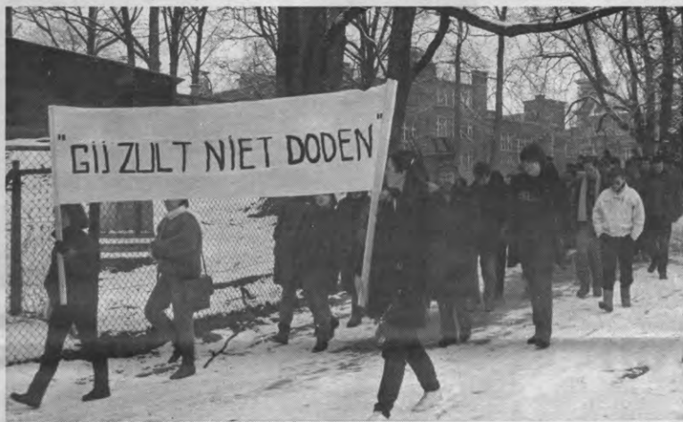
En gij zult ook niet met sneeuwballen gooien.

De wet van 1989 versoepelde de aanvraagprocedure. De termijn tussen de aanvraag en de indiensttreding bedraagt momenteel zowat vijf maanden. Konkreet verloopt de procedure als