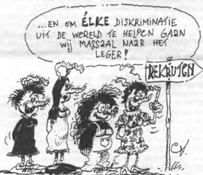
← vervolg van p.1

maar de functies met eindverantwoordelijkheid berusten meestal bij jongens - denk aan de praesefunctie - terwijl meisjes zich aandienen als medewerkers.