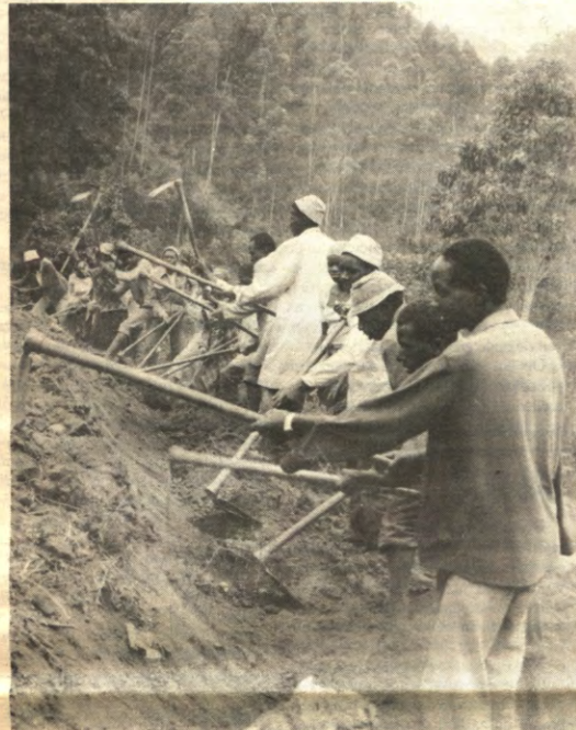
VREDESEILANDEN - Met man en macht wordt in Kabona, het tweede Vredeseiland, gewerkt om door de aanleg van nieuwe wegen de streek te ontsluiten. Met succes: de eerste handelaars hebben de weg naar Kabona al gevonden. U vindt hem op p.6.