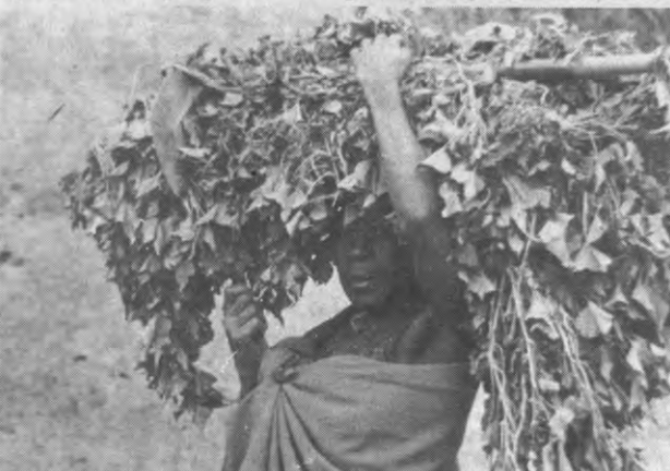
«Het liberalisme een succes? Heel Afrika is een puinhoop, er is een geweldige hongersnood, de bevolking sterft uit.»

Kruihof: «Metodologisch kan je op twee manieren werken om inzicht te krijgen in het geheel: ofwel ben je totalist – niet totalitair – en