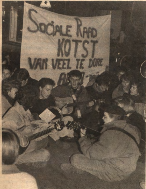
PING - Sociale Raad voerde weer eens efficiënt actie op de Bondgenotenlaan vóór Alma 1. Na drie minuten gitargepingel was het restaurant leeggestroomd: Alma kostt van Sociale Raad.

Wie nog meer informatie wenst of wil meewerken als vrijwilliger, kan terecht op het sekretariaat van Vredeseilanden. Ruelensvest 127, ☎ 22.25.53.