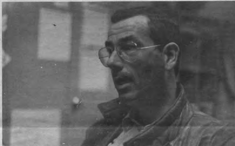
«Het onderwijs begin jaren '60 was onvoorstelbaar ouderwets en patriarchaal. Je waande je in de 19e eeuw.»

Nieuwdoorn: «In Alma was er al een tijdje medebeheer. Rond 1964 begon men ons ook advies te vragen op bijvoorbeeld het gebied van huisvesting, meebeslissen was er toen echter nog niet echt bij. We kwamen toen voortdurend voor typische problemen te staan. Zo was er de discussie rond de bouw van de huizenblokken Arenberg, bij het Sportkot. Wij hadden twee vragen. Ten eerste vroegen we een blok voor gehuwde