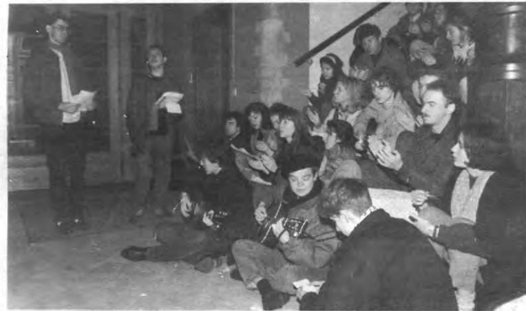
PONG - Toen het volk eenmaal buitengejaagd was, vatte de Sociale Raad-aanhang post op de trap in Alma I. A een, a twee, a drie: ene met hesp, en ene met kaas...

Behalve een nieuwe keuken zou het gebouw ook een beenhouwerij en de magazijnen herbergen. Die liggen nu verspreid over de verschillende vestigingen. Een ander voordeel is dat de Alma-maaltijden met een nieuw procedé ('vakuümkokken') zouden worden bereid. Ze kunnen dan enkele dagen bewaard, en zo kan Alma haar productie beter plannen. Hierdoor wordt de rendabiliteit gevoelig verhoogd. Alma zou natuurlijk een groot gedeelte ervan betalen, maar anderzijds heeft de RvB van de KUL ook toegezegd om op haar beurt 50 miljoen ter beschikking te stellen, plus een 'onbepaald' bedrag dat Alma aan gunstige voorwaarden zou kunnen lenen.