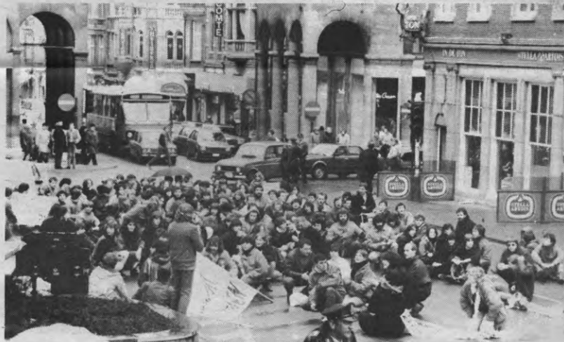
Bevindt beweging zich op kruispunt?