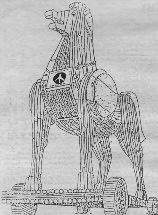
Illustratie uit de legerbrochure; met commentaar: "Paard van Troje... het huik opent zich, de speerpunten worden reeds zichtbaar."

Verlenging van de dienstplicht wordt afgewezen. Immers, het gaat niet op de latente discriminatie die nu reeds bestaat tussen enerzijds een groot aantal vrijgestelden en anderzijds de 'normale' dienstplichtigen verder in de hand te werken. In dit verband wensen de drie verenigingen de heersende politisering aan de kaak te stellen; een politisering die zich zowel bij de toekenning van de vrijstellingen als bij het bedelen van de taken manifesteert. Kan het soms de bedoeling zijn van