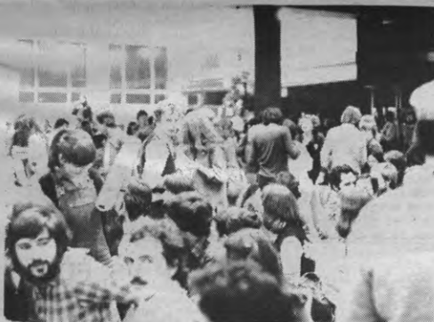
El Salvadordag: een drukte in Alma II.