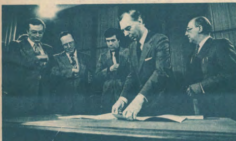
ZOVER IS HET NOG NIET, MAAR ...

En zo zie je maar weer: ook het kommunautaire heeft zijn goede kanten.