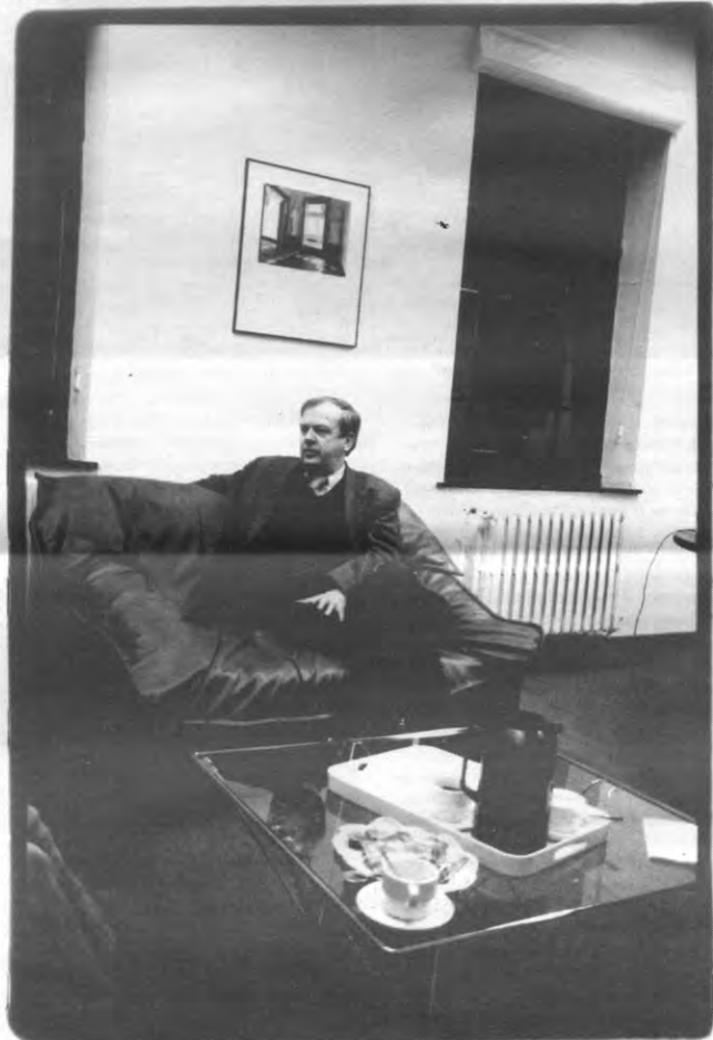
Lambert, Lambert, schiet den Ietsten Duits omveir

Veto: Macht speelt soms ook een rol in de wetenschappen. Hoe beoordeelt u de invloed van subjeektieve factoren in uw vakgebied?