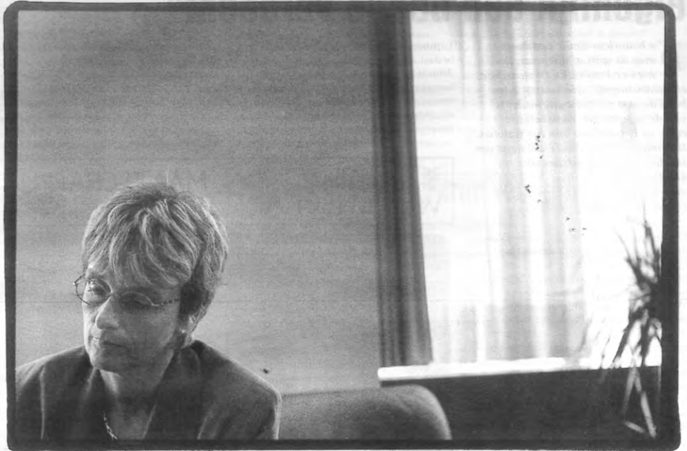
Eten koala's nog altijd eucalyptus blaaitjes?

De belasting over de toegevoegde waarde (BTW) die geïnd wordt, zorgt voor