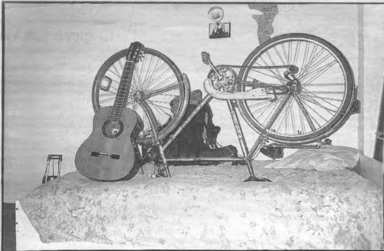
Zelf slapen we tegenwoordig buiten aan een ketting

te hechten en ook te laten graven. En als hun fiets toch gestolen wordt, moeten ze daarvan aangifte gaan doen bij politie of rijkswacht. Vooral die laatste twee tips zijn voor de politie erg belangrijk. Zo kan je je fiets gratis laten merken op het politiekantoor van Heverlee. Gegraveerde en goed beschreven fietsen maken immers meer kans om door de politie teruggevonden te worden. Een probleem is hier wel dat de politie zelf weinig initiatief neemt om contact op te nemen met de slachtoffers van wie een gemerkte fiets gestolen is. Wanneer je de diefstal van je fiets wil aangeven, moet je zelf naar het kantoor in Heverlee gaan, en misschien vind je hem daar dan wel terug. En als je daar niet naartoe gaat, want Heverlee is te voet toch wel redelijk ver, dan verkoopt de politie je fiets op een mooie