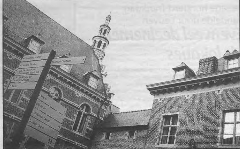
Hobu-studenten mogen binnenkort naar het toilet in het Van Dalekollege. Als ze er voor betalen.