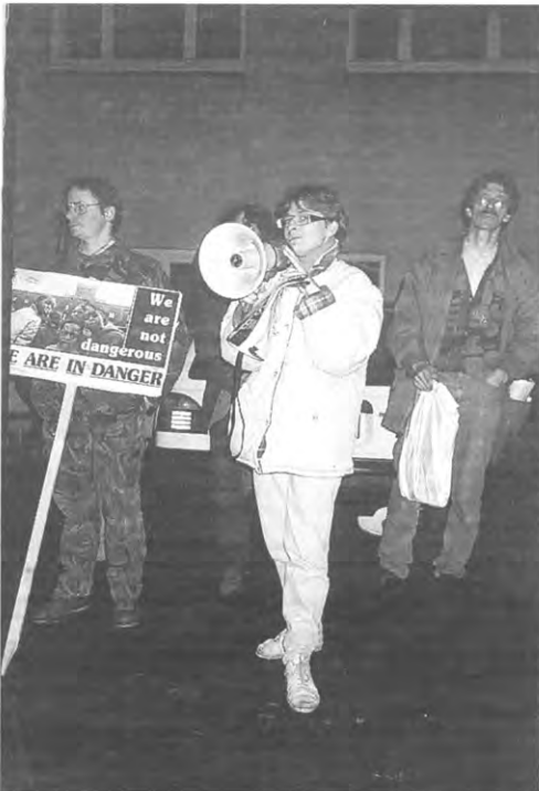
Drie man en een paardekop

Tevens zoekt het komitee vrijwilligers om een vluchteling op te vangen tijdens de kerstperiode. Al de nobele bedoelingen ten spijt is het nog maar de vraag of de donderwolven boven de Leuvense vluchtelingen kunnen afgewend worden. Het Atu stelt zijn hoop nu op de nieuwe Leuvense beleidsvoerders. Het wordt daarbij afwachten of Louis Tobback zich als burgervader iets milder opstelt dan