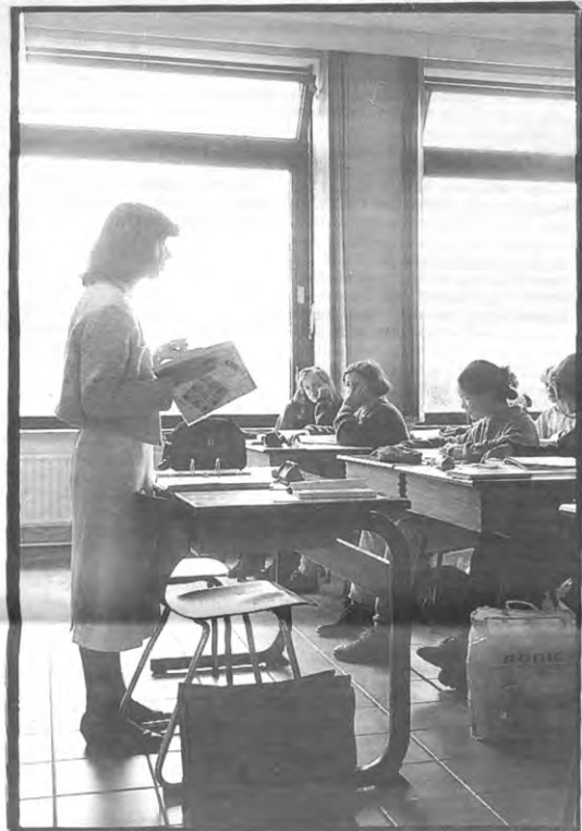
Volgt u nog?

Op een bepaald moment tijdens een pauze kreeg de minister een onweerstaanbare drang om de weerspannige student te spelen. Hij verweest zijn kabinetschef te behoren tot "het establishment", benoemde de big boss van het katholiek onderwijs tot minister en loste het volgende door hemzelf geformuleerde raadsel op: "Wat is een homo zoiders? Een bokfont!"