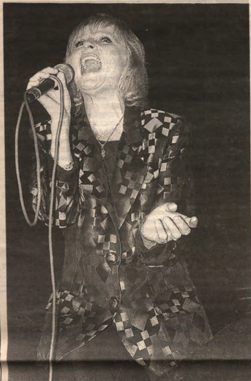
Doe alles wat je doet met hart en ziel. Bier, levensliederen en riooljournalistiek. Veto over het Smartlappenfestival op pagina 6.