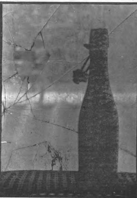
Mouterij gesloopt, eko-taks omzeild