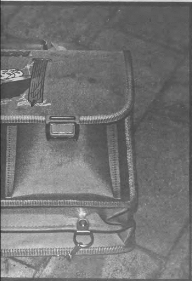
En als jullie flink leren, een nieuwe boekentas