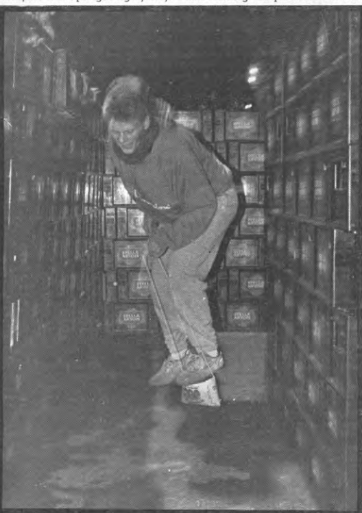
Vraag niet hoe maar hij is een draak aan het vellen.