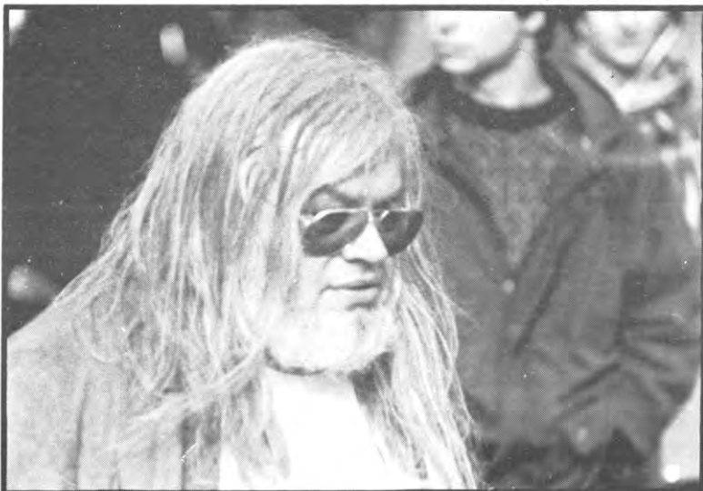
Leuvense studieadviseurs in een primitief stadium

Op gebied van studiemethode, blijkt er een vrij grote diversiteit tussen de repetitoren waar te nemen. Grosso modo kan men bij studiebegeleiding twee methodes aantreffen. Het beeld