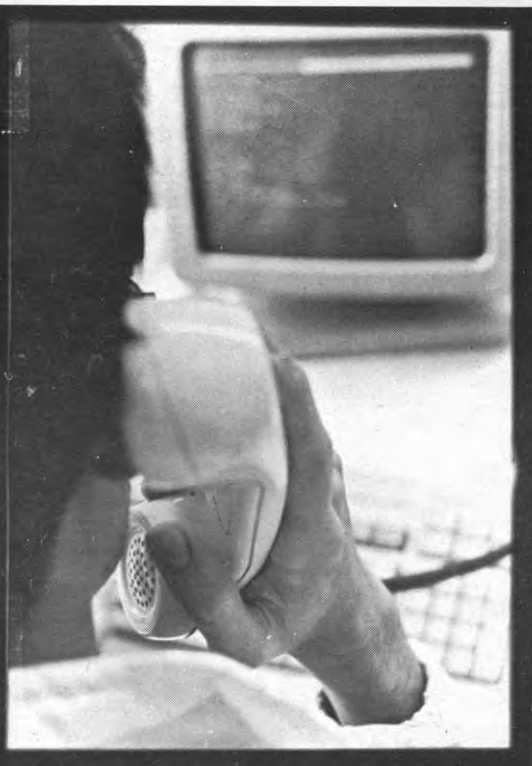
een hot-line met 3-suisse of een 06?