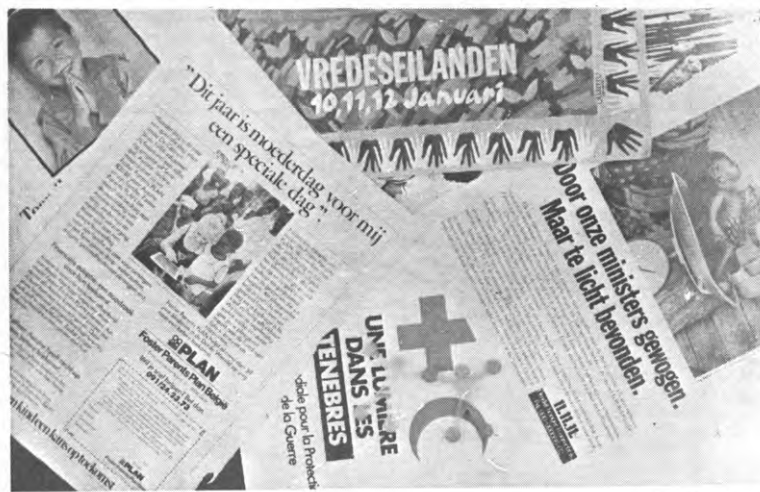
Een echte wildgroei aan bedelcampagnes

Redaktievergadering iedere vrijdagmiddag om 15.00 u