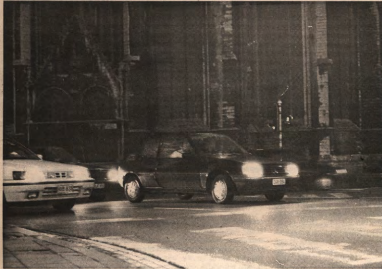
Hoe je het ook bekijkt, de auto rijdt zich steeds meer klem. Alle milieuvriendelijke technische aanpassingen maken zichzelf ongedaan door een massaal toegenomen autogebruik. Een voorbeschouwing bij het autosalon op pagina 5.

STUDENTENWEEKBLAD VAN DE LEUVENSE OVERKOEPLENDE KRINGORGANISATIE - JAARGANG 18, 1991-1992, NUMMER 13, MAANDAG 6 JANUARI 1992