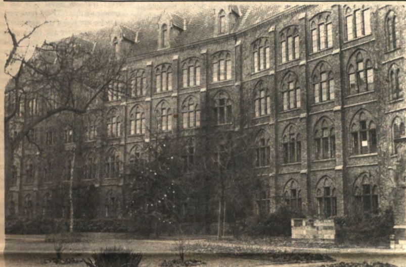
Kijk goed: de tralies zitten aan de binnenkant.

Leuvense Overkoepelende Kringorganisatie Verantw. Uitg.: Didier Wijnants 's Meiersstraat 5, 3000 Leuven Tel. 016/22.44.38