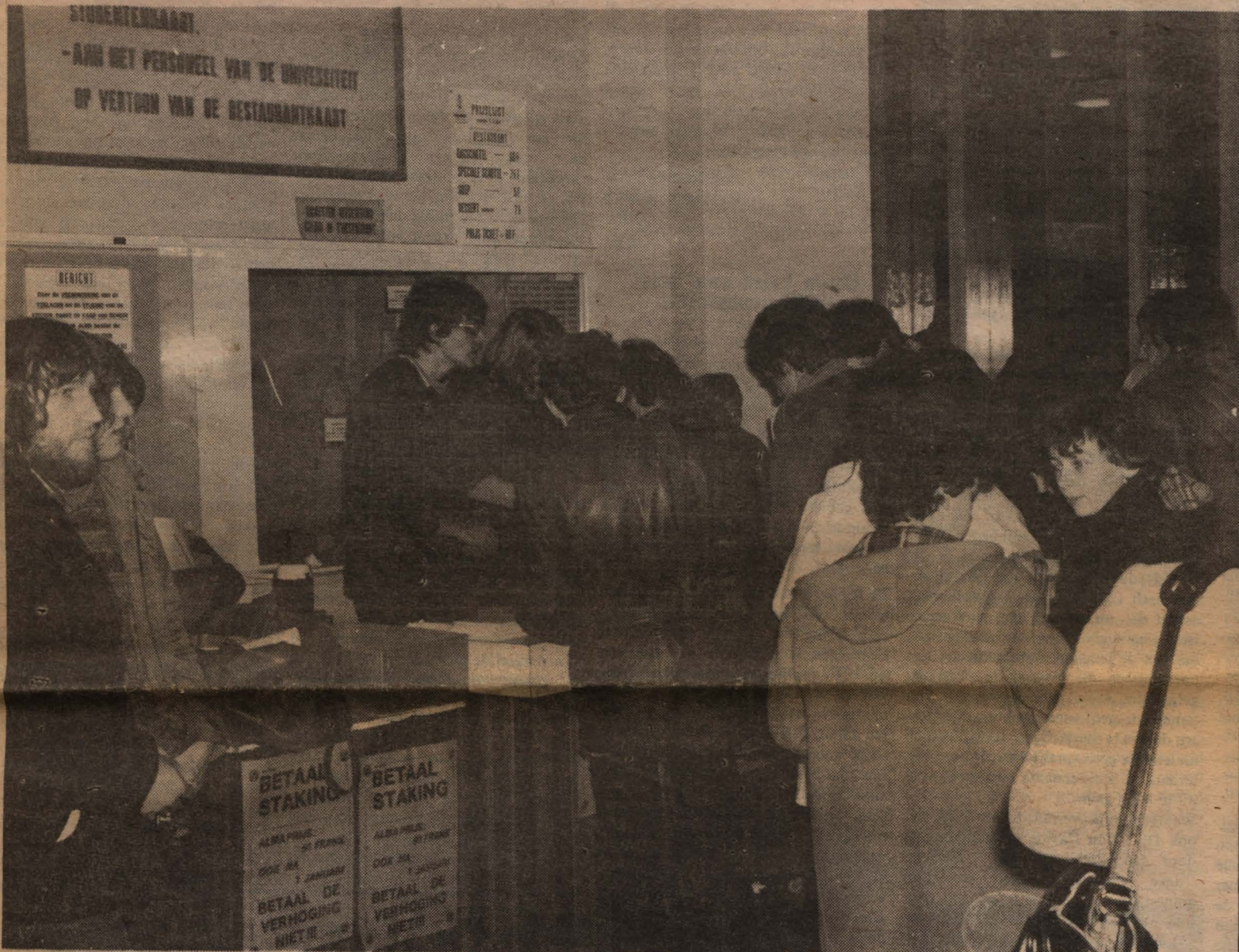
Aanschuijvende studenten bij de Sociale Raad-kassa. Leden van het praesidium van geschiedenis houden de winkel open. Maandag 4/1/'82, 11.50 u.

Verdere reacties worden door een popelende redactie ingewacht.