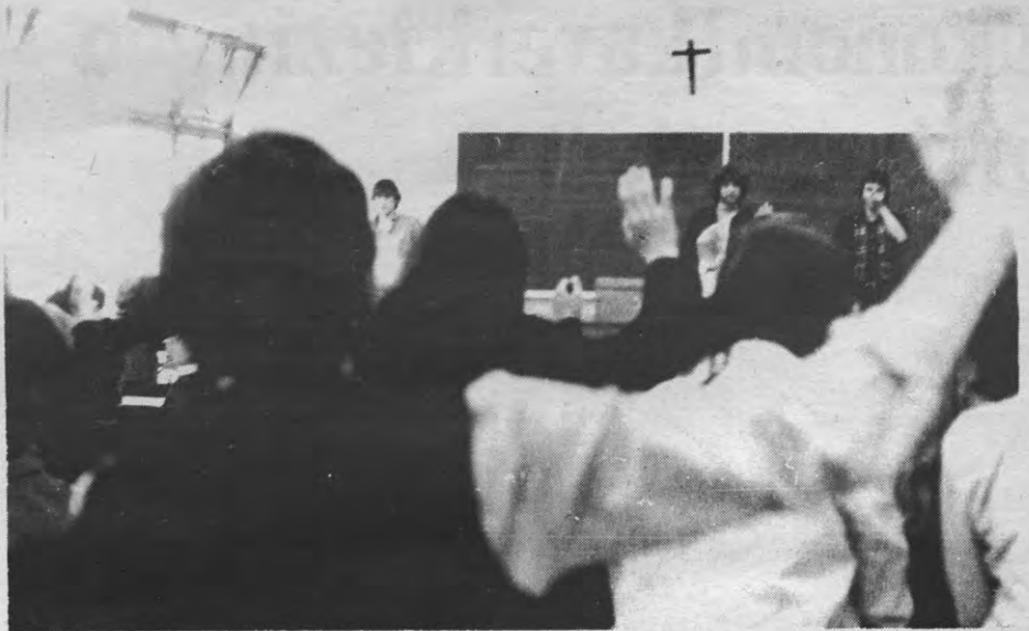
Geen disco-bar, geen bier. Maar zoals in Ekonomika : dicht bij je mensen staan primeert.