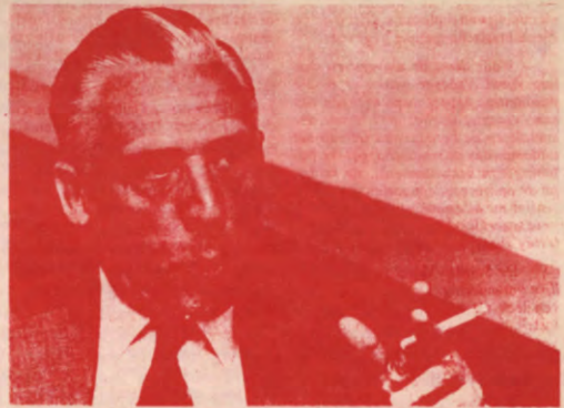
Wij: Eh, wat is er nu beslist op de Akademische Raad? De Somer: Dat lees je wel in het verslag.