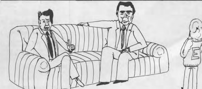
ALS GROTE MENSEN PRATEN MOETEN KINDEREN ZWIJGEN!

(Nvdr. Zoals je elders kan lezen had deze Veto - of tenminste de volledige versie van - op 17 december moeten verschijnen. Door een tussenkoms van de uitgeverij via dewelke Veto wordt gedrukt is dit niet mogelijk geweest. Deze Corner werd ongewijzigd uit Veto 12 overgenomen.)