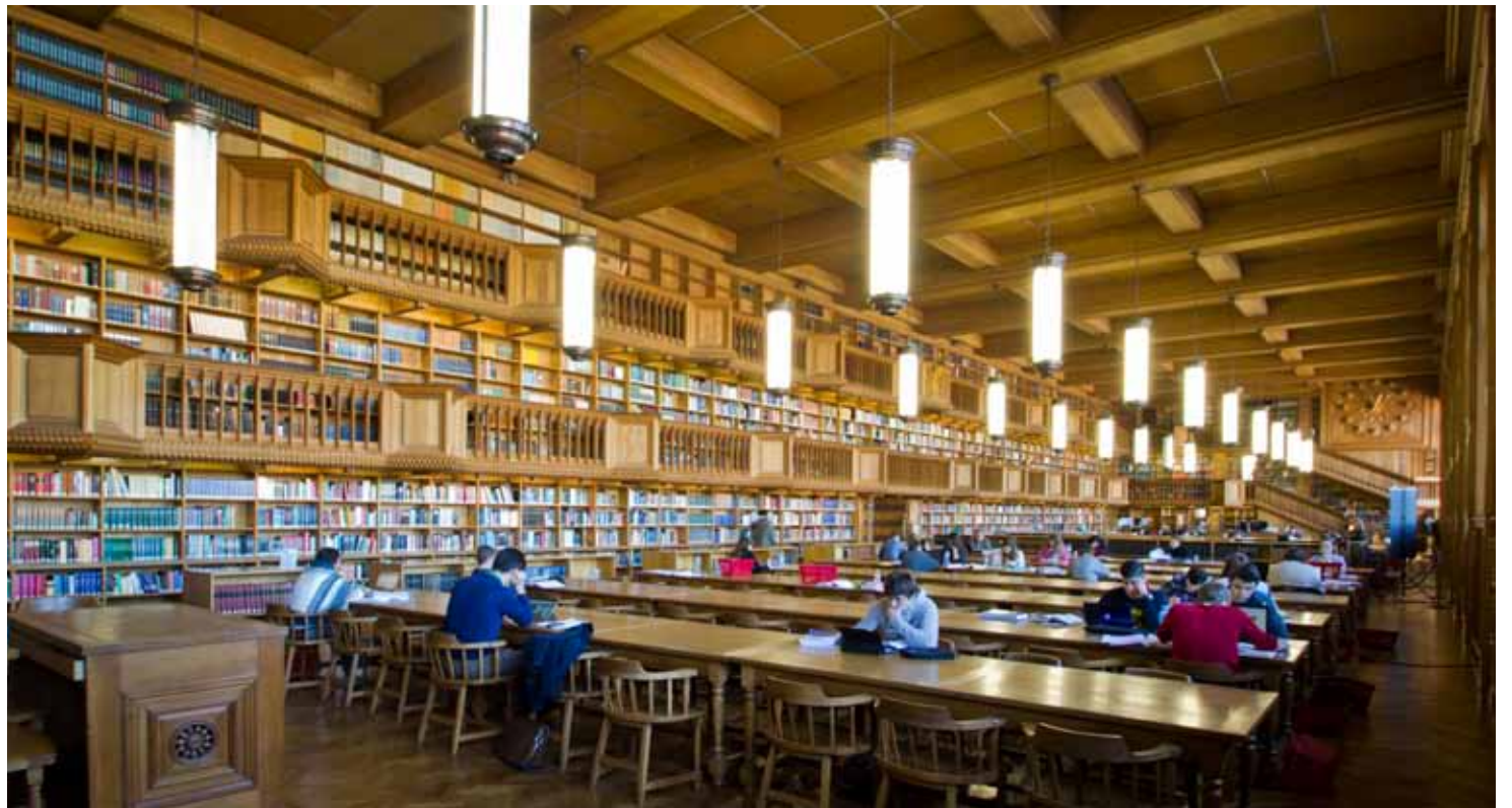
De Centrale Bibliotheek en de Letterenbibliotheek worden gereorganiseerd in de divisies Artes en Erfgoed & Cultuur