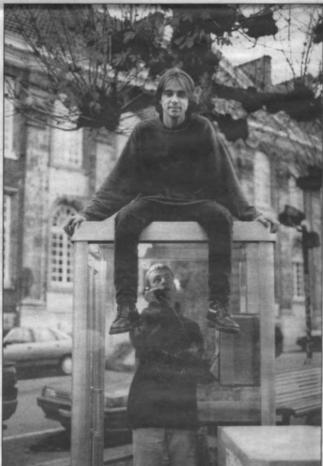
I'n like Ma Bell, I got the ill kommunikation

Veto: Misschien willen studenten gewoon niet