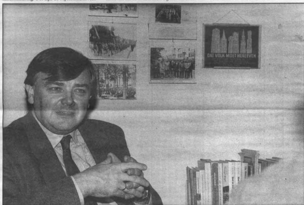
Dat volk moet herleven met zijn hoofsheid en durf

Veto: De demokratiseringsgedachte lijkt minder sterk te zijn dan vroeger, terwijl cijfers juist aantonen dat de demokratisering van het onder-