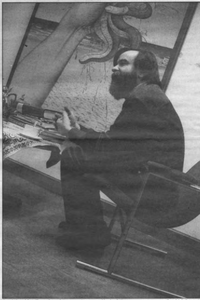
Om duizend kwallen te laten leven moet je er soms één doodnijnen

Veto: "De werking van de studentenbeweging