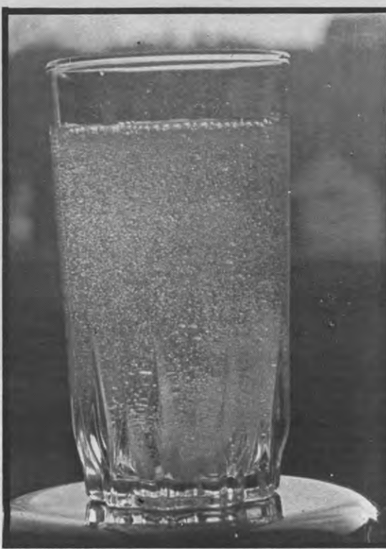
Storm in een glas water

Het feit dat de minister het aantal zelf bepaalt hangt natuurlijk samen met het feit dat hij die beslissing zal laten afhangen van de noden en, vooral dan, van een aantal financiële parameters, al is het maar omdat die noden in de gezondheidszorg moeilijk objectief te bepalen zijn. Het ontwerp-KB doet wel een suggestie om dat te bepalen maar vertrekt daar vanuit de bestaande toestand. Het aantal artsen dat mag starten zal overeenkomen met het aantal dat de pensioengerechtigde leeftijd bereikt heeft. Dat resultaat zou verkregen worden "door het aantal artsen binnen een bepaalde discipline te delen