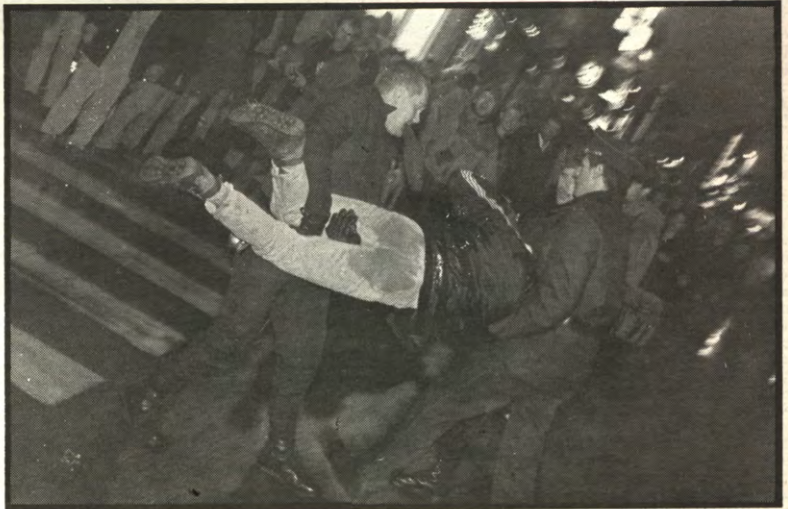
Nieuwe vorm van openbaar vervoer?

Uiteindelijk slaagde het gros van de aktievoerders er toch in om het kruispunt van de Bondgenotenlaan met de Vital De Coster straat te bereiken en algaauw was de Bondgenotenlaan afgesloten. Waar de politie verleden jaar de aktievoerders gedurende een half uurte nog liet begaan, hadden ze nu duidelijk minder geduld. Onmiddellijk werd ingegrepen en probeerden ze de zitstok op te ruimen. Dit bleek niet zo gemakkelijk te zijn, aangezien het gros van de aktievoerders nogal vastberaden was zich niet zo maar te laten afschepen na alle pesterijen op de vismarkt en de overdreven machtsontplooiing — Intussen waren immers ook rijkswachters met politiehonden ter plaatse gekomen. De politie besloot daarop de aktievoerders vijf minuten aktietijd te