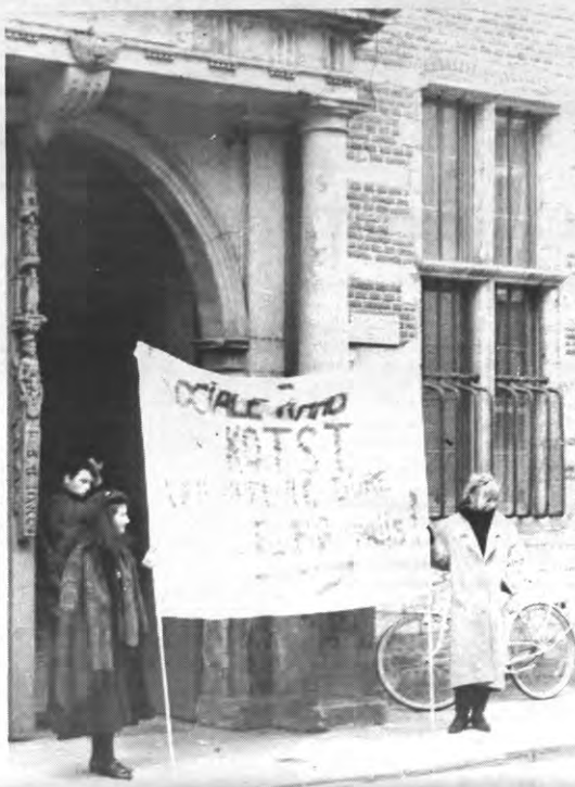
"Biotk eten, niet te vreten, wat er in die biotk zit!"