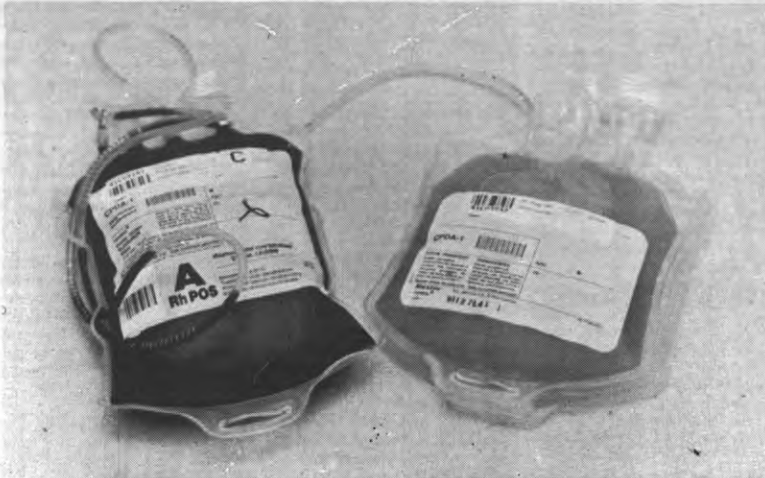
Links het blauwe, rechts het rode. Of was het omgekeerd?