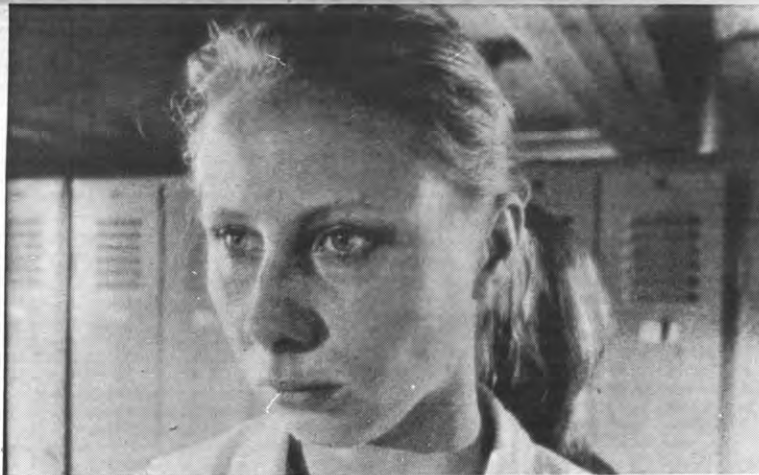
Het is geen schoonheid, maar ze is toch ook niet lelijk.

Behalve een nieuw teaterstuk van Nova Zembla programmeert het Stuc deze week alleen maar film. In het kader van Het lied in de film wordt op maandagavond 'Distant voices, still lives' gedraaid. Terence Davies schetst het leven en lijden van een Britse familie aan de hand van zijn eigen jeugherinneringen. Het gezamenlijk zingen van liedjes moet traumatische ervaringen verzachten. Dat die echter niet vergeten zijn, blijkt uit dit diep emotioneel maar innig mooi drama. De vier volgende dagen gaat de aandacht volledig naar 'The Match Factory Girl' van de Fin Aki Kaurismäki. Vorig jaar voltooide hij met dit deel een proletarische trilogie . Degenen die in juni als ontspanning films van het Stuc gingen kijken, herinneren zich de vorige luiken: 'Shadows in Paradise' (1986) en 'Ariël' (1988). De behoefte om te ontsnappen aan de grauwe Finse realiteit speelde ook in die films een belangrijke rol.