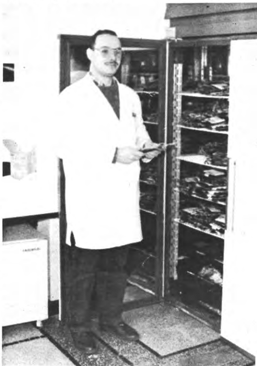
De ijskoman van dienst wijst de weg door de aorta.