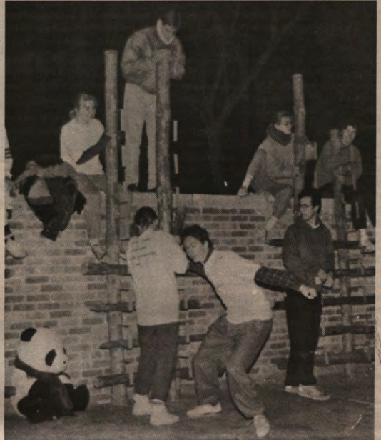
GRENZEN - Vorige week donderdag op het Sportkot: Sport zonder Grenzen. Voor een spetterende reportage van onze reporters ter plekke: zie pagina 5.