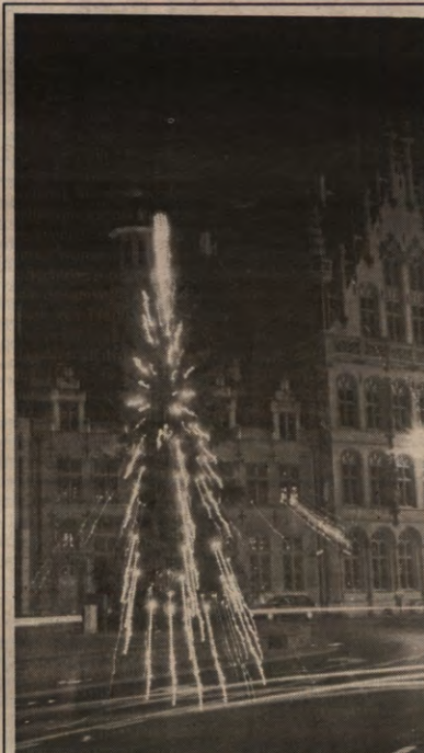
FANTASTISCH - Vooraleer u het zal beseft hebben, las u hier ter plekke een 'Prettige feestdagen vanwege de hele redaktie'. Ziet u wel? Wij zijn er terug binnen een drietal weken.

Die voorstellen gingen immers voor-namelijk in de richting van maaltijdprijsverhogingen. Zo zou de politiek van de laatste jaren gewoon voortgezet worden. Alma probeerde in die periode met een 'goed beheer' hardnekkig om alle problemen zoveel mogelijk binnenshuis op te lossen, in plaats van aan te kloppen bij de echte verantwoordelijken voor de