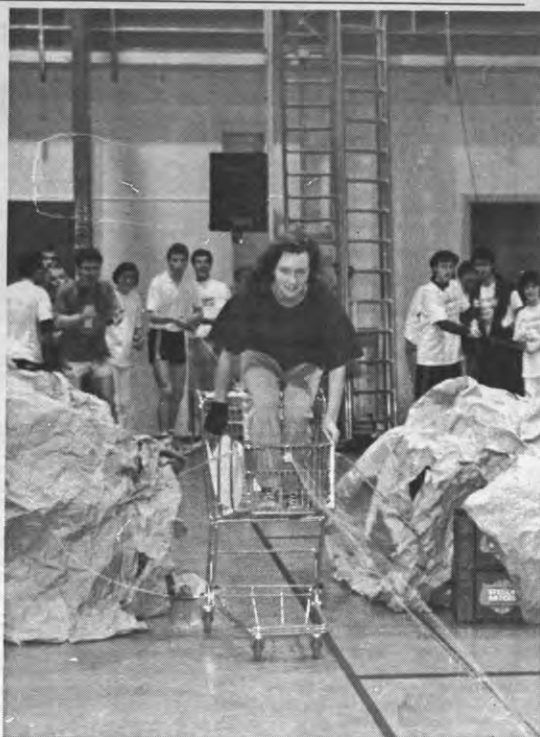
Net als toen we klein waren, met papa en mama in de GB rondzeeren.

De resterende vier proeven hadden buiten op de kampus plaats. Het tofste spelletje moet toch wel de bierbakken-doolhof geweest zijn, waardoor men zich blinddoekt een weg moest banen en enkele kledingstukken moest oprapen, op mondelinge begeleiding van de andere ploegleden. Het was de enige proef die, zij het in gewijzigde vorm, ook vorig jaar had plaats gevonden. Bij de andere drie proeven hoorden natuurlijk de obligate kwistaks-race en een snelheidsstafette, het 'ladderspel'. Ter afsluiting had Sportraad nog een grandioos eindspel in petto. Op het kunststofvoetbalveld moesten alle ploegen tegelijk een proef uitvoeren. Gewapend met 11 lege bierbakken moest een ploeg van 10 zo snel mogelijk het veld oversteken. Daarbij werd de lege bak naar voor