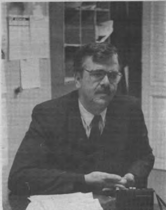
«Ik meen te weten dat de Belgen geprobeerd hebben om de toetreding van Taiwan tot de Gatt op de agenda te plaatsen.»

Steegmans: «De BDBH en onze nationale Delcredere-dienst (overheidsinstelling die handelsrisico's in het buitenland verzekert) ondervinden praktisch geen moeilijkheden. Er zijn wel kleine problemen omdat de Taiwanese niet dezelfde managementtechnieken hanteren als wij. Zij nemen het beheer van hun bedrijf misschien wat minder nauwgezet waar. Ook kunnen zij soms nogal veel