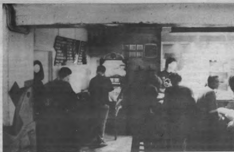
Te veel decibels in de bar trekt stevast muizen aan.

Hierbij aansluitend vervaagt in Europese context hoe langer hoe meer het onderscheid tussen universiteit en instelling voor hoger onderwijs. Daar waar universiteiten traditioneel theoretisch gerichte opleidingen van het lange type verzorgden, gebaseerd op een gedegen wetenschappelijk onderzoek, blijken deze karakteristieken niet meer exclusief voorbehouden aan universiteiten. Zo worden in Spanje en Italië binnen de context van uniëfs opleidingen van het korte type aangeboden. In andere landen bestaan dan weer opleidingen van het lange type op universitair niveau in niet universitaire instellingen zoals bijvoorbeeld de 'polytechnics' in het Verenigd Koninkrijk en de 'grandes écoles' in Frankrijk. Ook in dit verband kiest men voor de gemakkelijker oplossing: men spreekt voortaan van 'instellingen voor hoger onderwijs', kwestie van niemand voor het hoofd te stoten. Zo men niet beter opteren voor een klare naamgeving gebaseerd op enkele duidelijke criteria zoals het al dan niet gekoppeld zijn aan fundamenteel onderzoek van