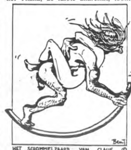
HET SCHOMMELPAARD VAN CLAUS ©