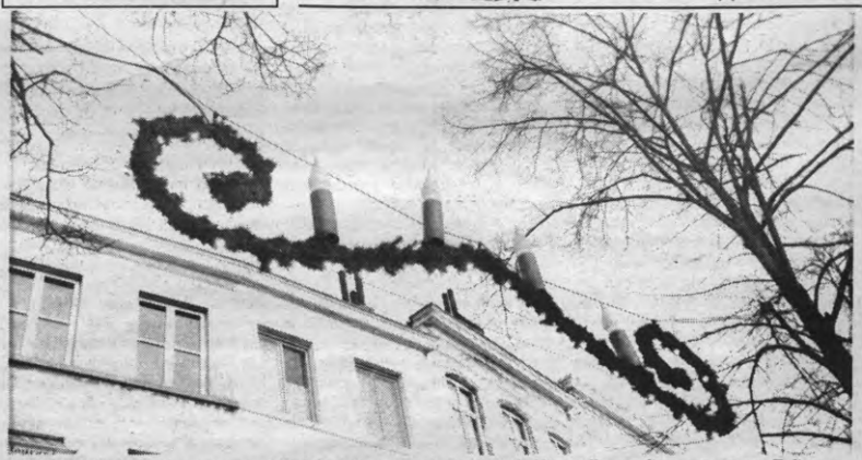
KERST - Eigenlijk zijn we er nog niet echt aan toe, maar als we plaats hebben vullen we die graag met een Zalige en een Gelukkige. Het kan niet vroeg genoeg. En laat het maar snel beginnen snewen.

Redaktievergadering: iedere vrijdagmiddag om 15.00 uur