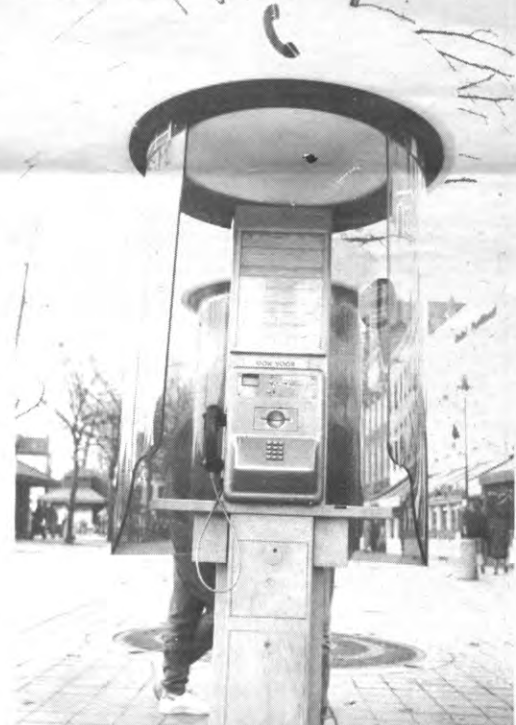
Morgen een studentelijijn. Over tien jaar iedereen gratis telefoon op kot?

hele ploeg. Het tikwerk van de briefjes op tekstverwerker gebeurd door het personeel van Teleserv. Tussen het binnemen van het telefoontje en het ogenblik waarop de boodschap in uw bus belandt, verloopt wel enige tijd. De verspreiding van de berichtjes gebeurt namelijk maar één keer per dag. Enkel voor heel dringende zaken - een sterfgeval bijvoorbeeld - komt men al wat sneller van achter het bureau.