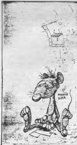
krantenwinkels, net zoals de 'Standaard'-strips.»

Matton: «Die serie is ook niet voor stripnieuws bedoeld, maar voor kleine kinderen. Wij moeten niet enkel strips uitbrengen voor volwassenen of adolescenten, maar ook eens denken aan de jongsten. 'Zilverpijl' wordt overigens hoofdzakelijk aan de man gebracht in