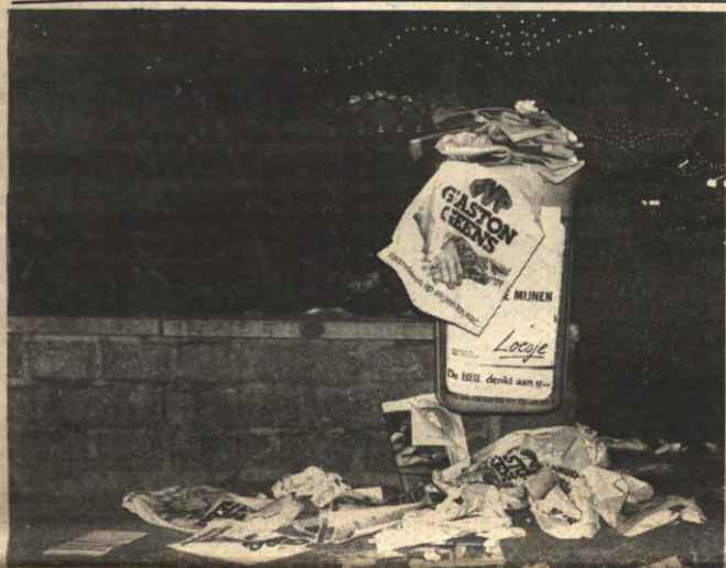
VERKIEZINGEN - Gisteren nog voor houvast, vandaag losjes in de prullemand. België werd ter stemming geroepen, en de politici lieten de straten bevuild achter.

Hoe zit het tegenwoordig met de ontwikkelingsamenwerking? De zopas beoordeelde regering heeft er niet bepaald veel aan gedaan, integendeel zelfs. Dit departement heeft de laatste jaren fors moeten inbinden. Aan de andere kant bestaat er echter ook discussie over de manier waarop de ontwikkelingsamenwerking concreet moet werken. Grootchalig of kleinschalig? Pagina 4.