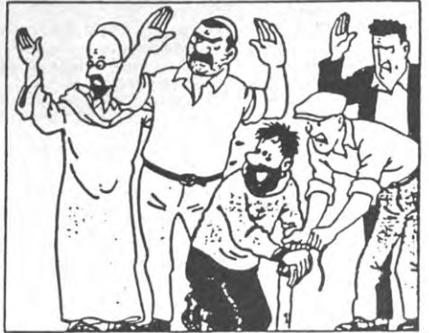
Hergé wast (na censuur) witter dan wit.