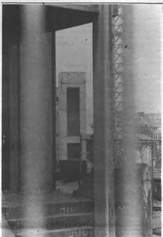
AULA MAXIMA - Die geruststelling heb je tenminste nu al: als die Aula Maxima annex De Somer er ooit komt, zal er een lift zijn. Zo zal de student die de bovenste rij van het auditorium bevolkt, zijn plaats tenminste in stijl kunnen opzoeken. Ha, de vooruitgang. Neen, de opgang.