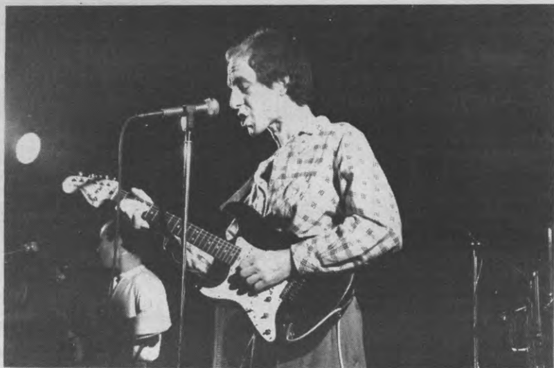
Raymond Van het Groenewoud: "Volgend jaar kan ik weer zagen dat er teveel volk komt naar mijn optredens"