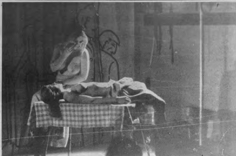
Het Grote Klaarkomen: zeg dat wel...

De meeste bezwaren heb ik echter tegen de tekst. Losse flarden kunnen ideaal zijn om alle facetten van een probleem te belichten, maar dan moet je wel voor een konstante ton zorgen. Sommige teksten zijn heel sterk en worden ook aanvaardbaar gebracht, maar meestal zit je te luisteren naar diepgaande, ideologisch verteken(en)-de manifesten die gewoon niet op de planken te brengen zijn zonder overvelend over te komen. Om dat te