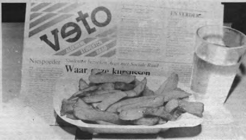
Zal men binnenkort de frieten per stuk moeten kopen? Als het van de regering afhangt blijkbaar wel. Op de Raad voor Studentenvoorzieningen werd alvast een verhoging van de Almaprijzen in het vooruitzicht gesteld.

Een gewaarschuwde dienstplichtige is geen rekrut waard... □