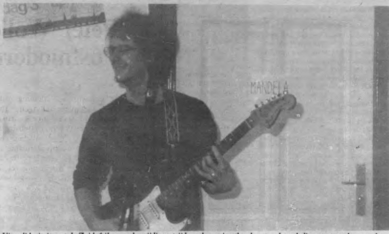
Uit solidariteit met de Zuidafrikaanse bevrijdingsstrijd en -beweging, herdoopten de godsdienstwetenschappers hun kringlokaal in "Mandelalokaal". Zij zijn bereid deze pastorale activiteit ook in andere kringen te volbrengen.

Botha kan dus de apartheid niet opheffen want hij moet de belangen van zijn blanke kiezers verdedigen. Maar, dient dit regime wel het algemeen belang. Ook dat van de zwarten? Uiteraard niet. Zodoende kan het kwaad enkel weggenomen worden door een verandering in de kieswetgeving.