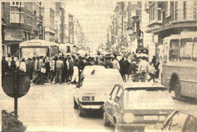
Sferbeeld van de zebrapadenaktie: de Bondgenotenlaan danig gekonstipeerd.