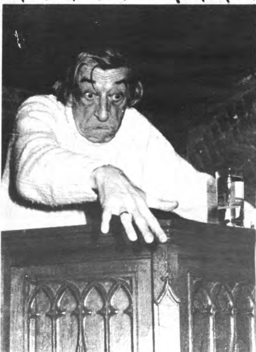
Het priesterambt ligt definitief in duigen. Neem nu deze kanseldrediker: duidelijk te diep in het glas en teveel naar de vrouwen gekeken. En hij is verdorie nog getrouwd ook.

En dan hebben we het nog niet over de rommelige lay-out gehad, die, perfect in overeenstemming met de inhoud, ook niet kan wedijveren met de stijlvolle aanpak van bv. Bannales. Tja, misschien hebben we hiermee een rivaliteit veroorzaakt binnen de muren en tussen de verdiepingen van het Kremlin daar achter de bibliotheek. Als dat de kwaliteit nog opdrijft, kunnen wij daar alleen maar blij mee zijn. En u ook. Vanzwanske