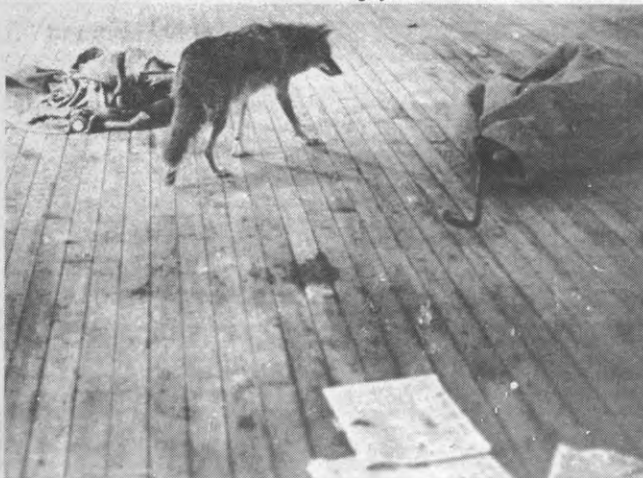
Joseph Beuys, "I like America and America likes me", New York, 1974.