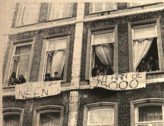
Om meer informatie te bekomen over het regeerakkoord bezetten een veertigtal studenten verleden week donderdag het "Schieperskwartier".