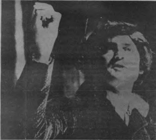
"Torquato Tasso" heeft reeds drie interessante versies gekend. Wat Decortie van zijn "Vlaamse Tasso" zal maken is nog niet zo heel duidelijk.