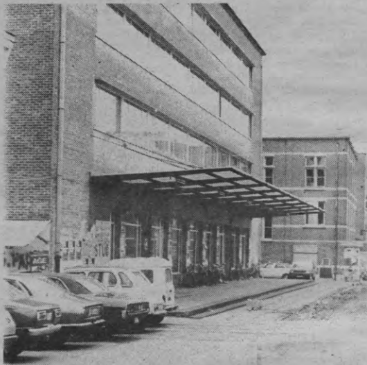
Het drijfzand waarop 't Stuc zich de laatste dagen bevond, lijkt momenteel wel gestold te zijn tot een iets vastere ondergrond. Onderaan p. 7 vind je een kadertje met de juiste evolutie van het BTK-probleem gedurende dit akademiejaar.