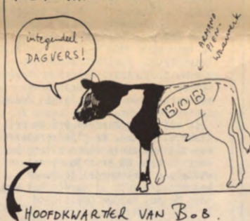
HOOFDKWARTIER VAN BOB.