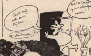
JEP = july voor eenige praktijken in de sublaan.