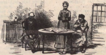
Een veelgezien beeld op de Tele-Dienst

Naar aanleiding van de splitsing van de KUL-UCL rezen een paar problemen rond de vzw Alma (= de unitaire Alma). De UCL trekt zich terug uit de vzw, die wordt de KUL Alma overneemt. Dit kost de KUL slechts een 4 miljoen