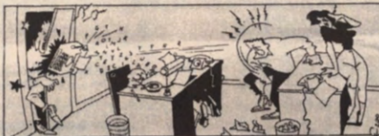
Onder deze rubriek worden reacties van lezers afgedrukt; naam en adres moeten aan de redaktie bekend gemaakt worden. De redaktie heeft het recht ingezonden stukken in te korten, zonder evenwel aan de inhoud er van te raken. Ook houdt de redaktie zich het recht voor te antwoorden op brieven.