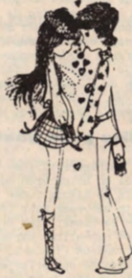
verliefd... getrouwd... en dan de miserie om een beurs vast te krijgen

aanvraag. Geen antwoord. Toen er tenslotte rechtstreeks contact werd opgenomen met de Dienst, werd geantwoord dat laatstijdige aanvragen 'voorlopig' niet beantwoord worden. Baf! Zondermeer. De reden hiervan werd na veel moeite ook losgemaakt. Er zou een K.B. ter ondertekening onderweg zijn om dergelijke gevallen te regelen. Indien dit werkelijk het geval zou zijn, zou Verdren terminata zo beleefd mogen zijn om de betrokken personen, na hun (eerste) aanvraag, hiervan op de hoogte te brengen. Had de student niet doorgebeten, dan had die er nu waarschijnlijk het bijtje bij naergelegd in de veronderstelling dat er voor hem geen beurs te bemachtigen viel. We schreven hierboven welbewust "Indien". Want het mooiste van de zaak is dat het bedoelde K.B. wel slaat op het sekundair onderwijs, maar niet op het hoger!