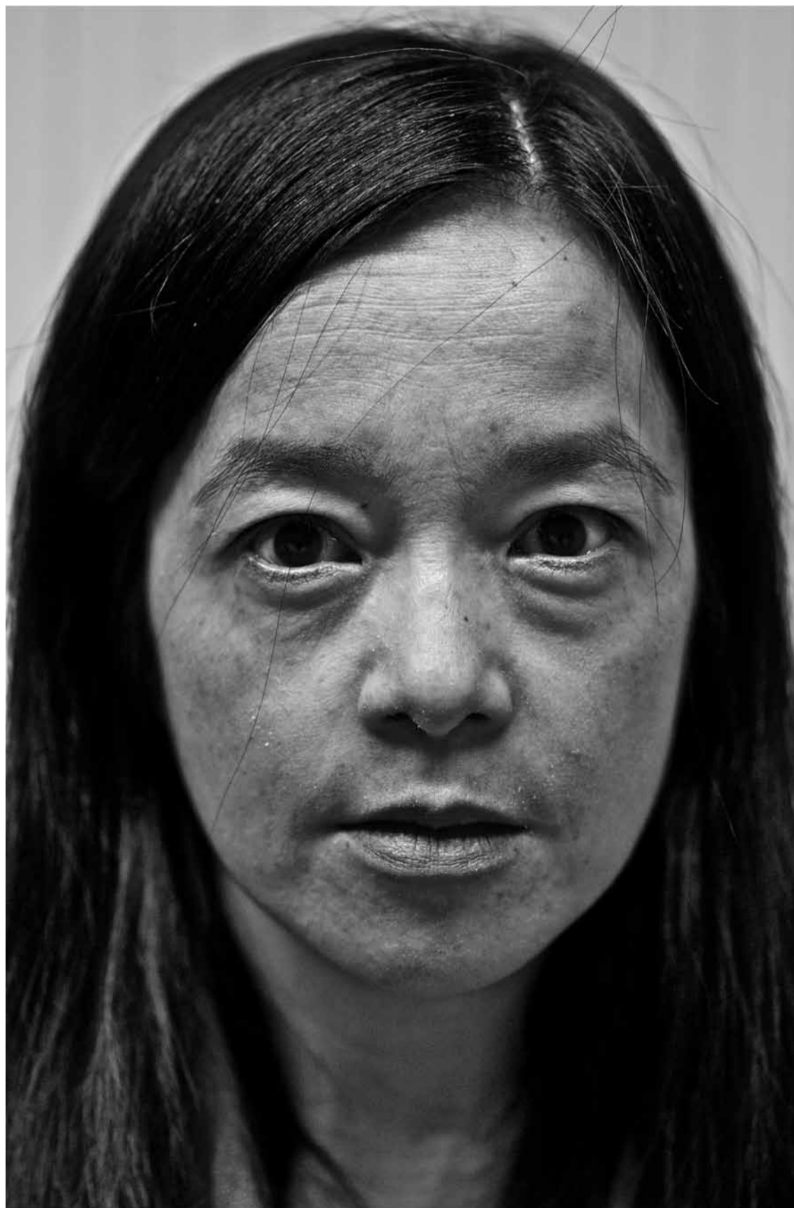
Professor Pang: “De dochter van de voormalige dictator is kandidaat-president. Ze is populair bij 50+ers”

«Daardoor heeft Zuid-Korea in de afgelopen decennia een fascinerende metamorfose ondergaan. In de jaren '70 was het militaristisch en sterk gericht op de economie. Nu is er veel meer openheid. De Zuid-Koreanen geloven in mensenrechten en democratie. Bovendien is er een Korean wave ontstaan: de Zuid-Koreaanse populaire cultuur verspreidt zich over Azië. Alle Aziaten zijn verzot op de populaire cultuur van Zuid-Korea.»