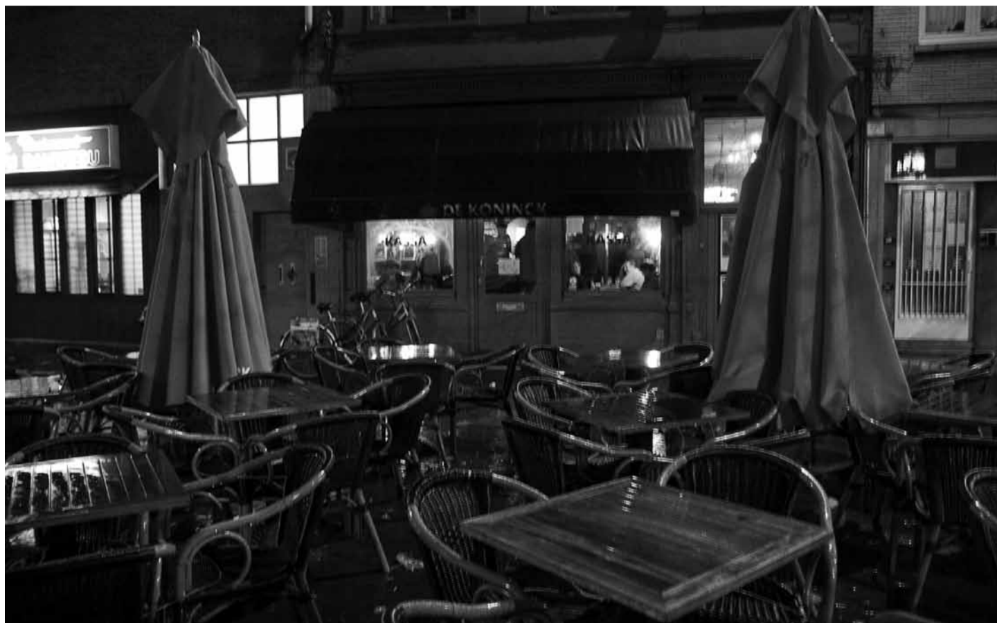
De Ossenmarkt en het café Kassa 4 worden regelmatig aangedaan door Antwerpse studenten.