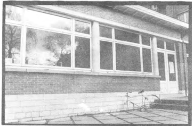
Een fiets, een schooltje en wat wijn. Ach, het leven kan best gezellig zijn