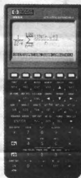
HP 48SX: Wetenschappelijke Uitbreidbare Calculator

Hij kan de rekeneenheden van alle gegevens van een probleem omzetten tot een eenheidssysteem zodat