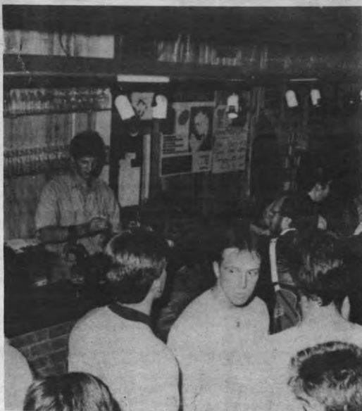
Gelukkig blijven gratis vaten fiscaal aftrekbaar.