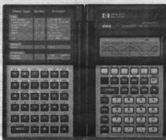
HP 28S: Geavanceerde Wetenschappelijke Calculator

De ware meesters herkent men ondermeer aan hun instrumenten.