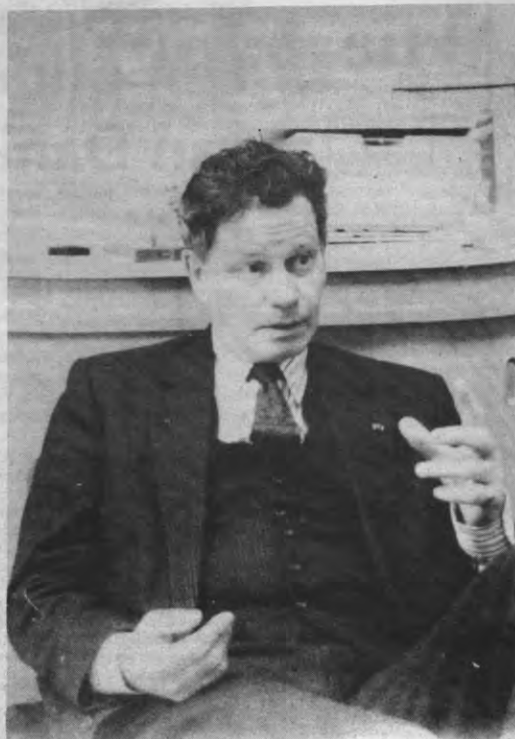
"Ik ken weinig gevallen van huwelijken tussen universitair en bloemverkoopsterjes"

Veto: Maar is het dan niet in de eerste plaats de taak van het PMS om mensen verschillende jaren individueel te begeleiden en dan een gefundeerd advies te geven? Zo moet er geen drempelverhogend examen ingevoerd worden.