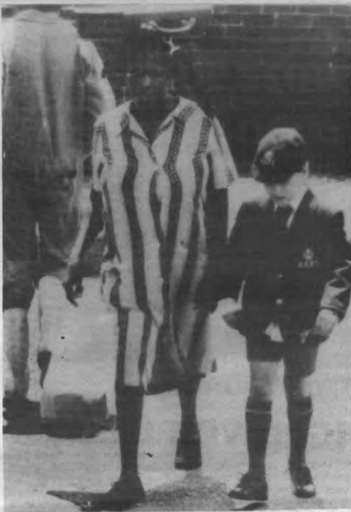
De zwarte bevolking in Zuid-Afrika gaat gebukt onder de zware last van de blanke overheersing.

De drie Zuidafrikaanse gastsprekers riepen in een slotmemorandum op tot het behoud van het isolement van