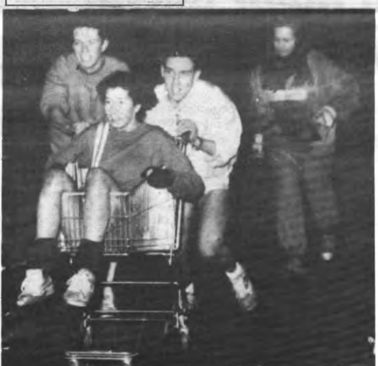
Er doen weer hardnekkige geruchten de ronde over handeljes in blanke slavinnen. Ziehier de daders.

die je betaalt voor 'Ons Leven' is in feite lidgeld). Studenten die denken niet thuis te zullen zijn als de postbode langskomt, en geen lid willen worden, kunnen volgens de tekst best hun ouders verwittigen. Om misverstanden te vermijden moet je die tekst in 'Ons Leven' dus wel lezen. Hier knelt het schoentje. Een aantal 'slachtoffers' wisten ons te vertellen dat ze nooit een 'prospectusnummer' gezien hadden. En als je er dan al één hebt, moet je het blad nog lezen ook. Elk jaar worden dan ook een groot aantal studenten onwetend lid. Geen nood echter, als je te weten komt dat je lid bent, volstaat een bezoekje aan de Krakenstraat 13. Je lidgeld wordt binnen de week teruggestort. Tenzij je je daar laat opvriren voor de 'Vlaams-nationale' zaak, natuurlijk.