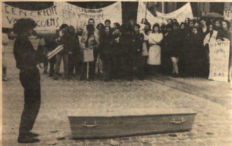
Schallende megafonen op het Ladeuzeplein. L&W bestist: Coens in de kist!

STUDENTENWEEKBLAD VAN DE LEUVENSE OVERKOEPELENDE KRINGORGANISATIE - JAARGANG 17, 1990-1991, NUMMER 11, MAANDAG 3 DECEMBER 1990