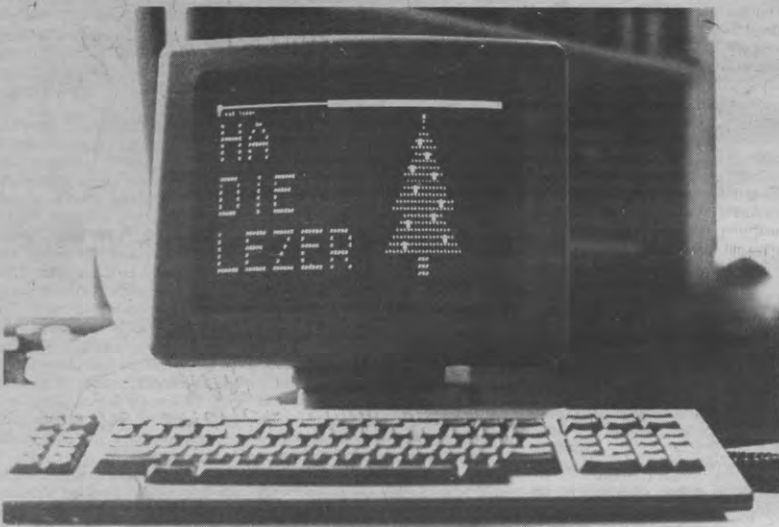
(Scherm Filtp Huyzentruyt)