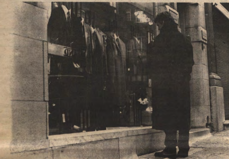
BB 4 - Veto ging op zoek naar de mensen die achter deze loge-achtige benaming schuilgaan. Een onthullend artikel op pagina 5