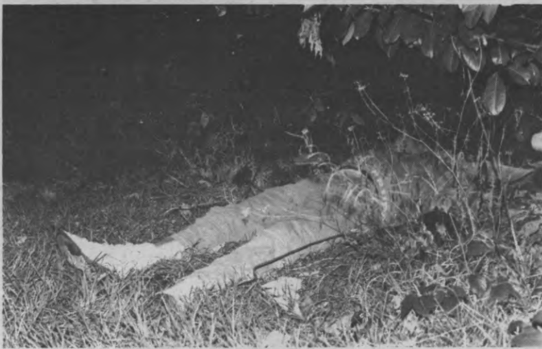
Wat rust daar in het struikgewas?