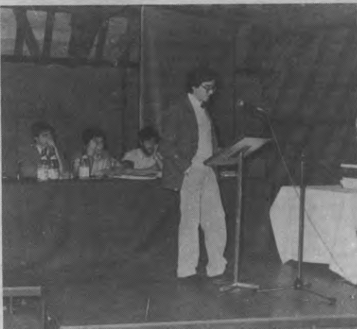
Een studienamiddag over arbeidsflexibiliteit en flexibele arbeid: wat is de vlug en wat is de lading?

Arbeid kan op verschillende manieren georganiseerd zijn. De 40 uren in de 5-dagenweek is de meest gekende. Nu is arbeidsorganisatie en economie een huwelijk dat niet altijd even gelukkig uitvalt. Een arbeider is ook maar een mens: hij mag dus aan zijn werkgever (lees: de economie) bepaalde minimale eisen stellen. Lan-