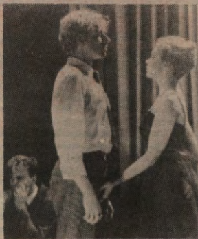
Op de cultuurpagina's: twee teaterbesprekingen (op de foto: Akt-Vertikaal), een poging tot inzicht in Marcel Broodthaers en een stukje over 'bewogen' fotografen: p. 6 en 7.