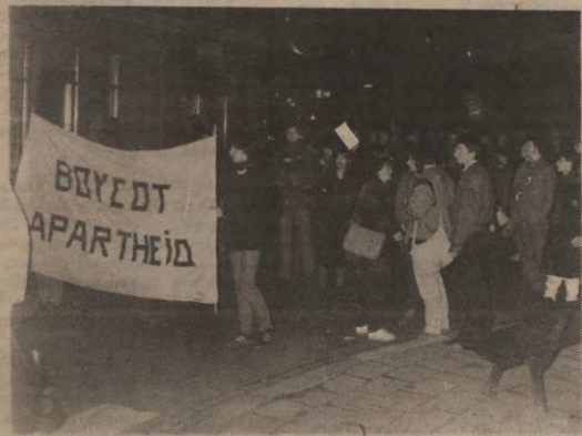
BOYKOT APARTHEID — Het zag zwart van het volk op de betoging die de Dag tegen Apartheid afsloot. De betoging volgde op een meeting met de mensen uit het zwarte verzet, derde wereld-organisaties en het Boykot Komitee. In verschillende fakulteiten werden ook alternatieve lessen georganiseerd.