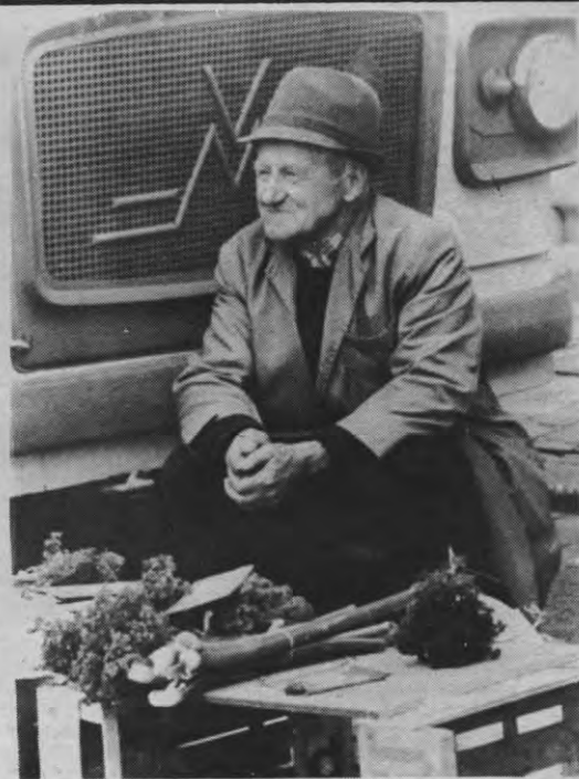
Denk vooral niet dat dit geen bewogen foto is. Bij de zogenaamde 'bewogen' fotografen gaat het om 'sociale bewogenheid'. Wat niet wegneemt dat deze peterselle best wat beweging kan gebruiken.

Mensen die er iets voor voelen om bovenvermelde taken te helpen realiseren, zijn nog steeds welkom bij de 'Bewogen' Fotografen. Van nieuwe leden wordt geen lidgeld gevraagd, enkel een 'goede houding', dit wil zeggen het steunen van de filosofie van de klub (cfr. supra). De nieuwe