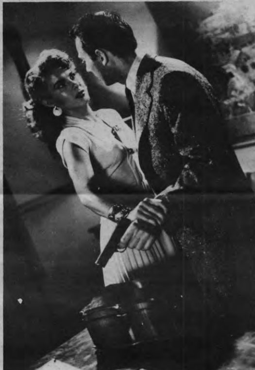
Nee, dit speelt zich niet af op een woelige zee. Deze scheefheid is één van die typische noir-trekjes, zo zeggen de 'kenners'. (Still uit 'Out of The Past')