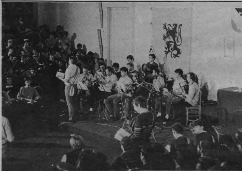
Nooit hadden de Commilitones(kes) meer noten op hun zang.