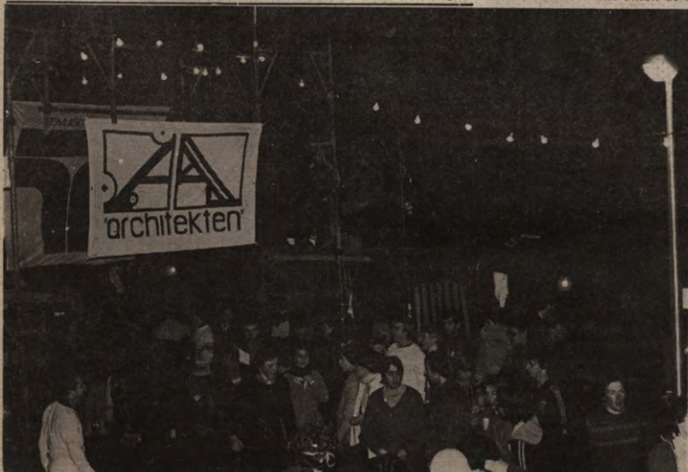
Uitslagen van een spetterende 24-uren op de middenpagina's.

Als klap op de vuurpijl zou men na afloop bij gedooft verlichting een saluutrone lopen met heuse fakfels. De klanken van Chariots of Fire schalden over de piste, om iedere sportieve gevoelige ziel de krop in de keel te rammen. Door de maas toeschouwers liep de kolonne jammerlijk vast. Maar dat kon de jubelsfeer bepaald niet dempen. Bert Malliet