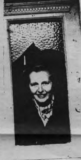
Thatcher: beleid door Friedman geïnspireerd.

beschikten; een ideaal deflatorieklimaat openbaarde zich: daling van de productie, van de bestedingen, van het nationaal inkomen. De «Great Crash» buitte ook de zwakheden van de bedrijven uit: vele bedrijven moesten hun activiteit verminderen of werden opgedoekt door de ineenstorting van de holdings en investment trusts. De banken stuikten in mekaar omdat ze in liquiditeitsnood kwamen na de massale opragingen wegens de falen van enkele banken. De fatalistische ingesteldheid en het conservatieve beleid (Keynes' anti-cyclische therapie leek nog veraf) verergerden de depressie aanzienlijk. J.K. Galbraith besluit dat met een gezonde ekonomische toestand in 1929 de gevolgen van de ineenstorting van de effectenbeurs minimaal zouden geweest zijn. Nu bektomtoonde de «Great Crash» de kwetsbaarheid van de zakenwereld.