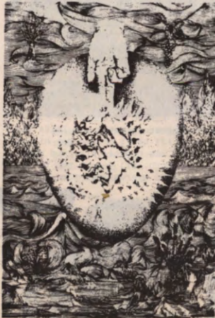
VETO: Kan je met de Passage alle psychische probleemkategorieën aan?

een dimensie meer hebben dan de doorsnee-mens. Ze lijden aan een teveel aan werkelijkheid waarmee ze niet terecht kunnen. Deze mensen hebben een fantastische herinnering aan het getraumatiseerde zijn vanaf de conceptie. Als je de zaken zo gaat bekijken kan je de ouders gaan deculpabiliseren. Wat enorm belangrijk is. De klassieke psycho-analyse is een culpabiliseringsproces. Niemand kan echter de schuld leveren. We hebben geen schuldigen nodig. Anderzijds krijgen we inzicht in de psychodynamiek om van daaruit aan doorlichting te kunnen gaan doen van de maatschappelijke structuren. We kunnen gaan verklaren waarom het fout loopt met bepaalde structuren, hoe bepaalde culturen na enkele eeuwen op een zijspoor gereden. Wij zijn duidelijk de progressieve evolutie naar het paradijs vergeten. De geschiedenis van de laatste jaren heeft ons genoeg geleerd. In naam van principes worden de laatste jaren honderd miljoen soortgenoten eigenhandig afgeslacht.