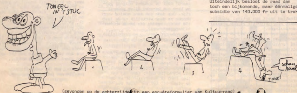
(gevonden op de achterzijde van een enquêteformulier van Kultuurraad)