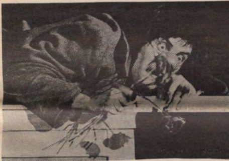
CIRCUS ALFRED: CLOWNERIES

Twee goede ideeën van TURBA liggen aan de basis van de creatie "Les Clowneries", namelijk spelen met een oneindige berg papier en met abstracte klankgolven. Daarbij kwamen dan variaties op de Fratellini's gespeeld met licht en op thema's van de bundel van Tristan Remy.