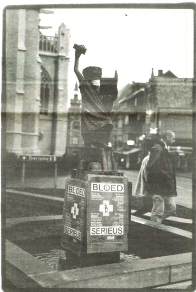
"Ik zou zo graag Manneke Pis willen zijn"