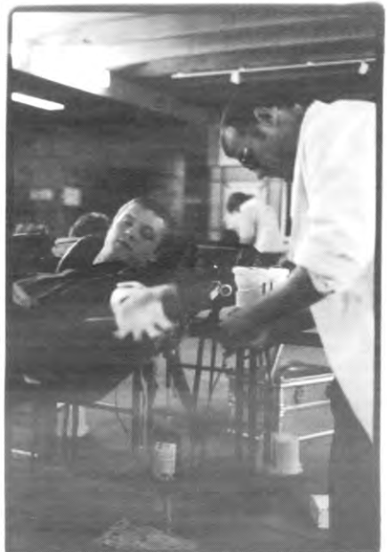
Hey poepkeh, ik zal is on au aderkes zitteth