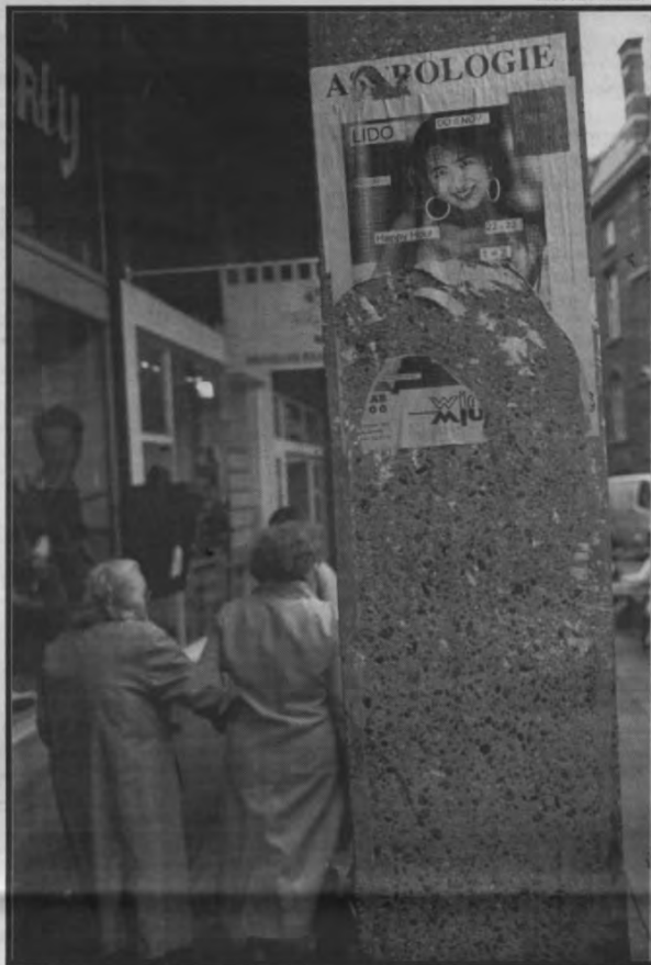
Ik heb een schaap, twee geiten en een vrouw

Dat schoonheidsideaal lijkt steeds minder op de realiteit. Zo heeft men bijvoorbeeld gekonstateerd dat modellen twintig jaar geleden ongeveer acht procent minder wogen dan de gemiddelde vrouw. Vandaag is dat opgelopen tot drie-entwintig procent. Dat leidt tot een ziekelijke streven naar een modellichaam, tot een nooit aflatende strijd tegen het reële lichaam en zijn vochtscheidingen, zijn natuurlijke neiging tot