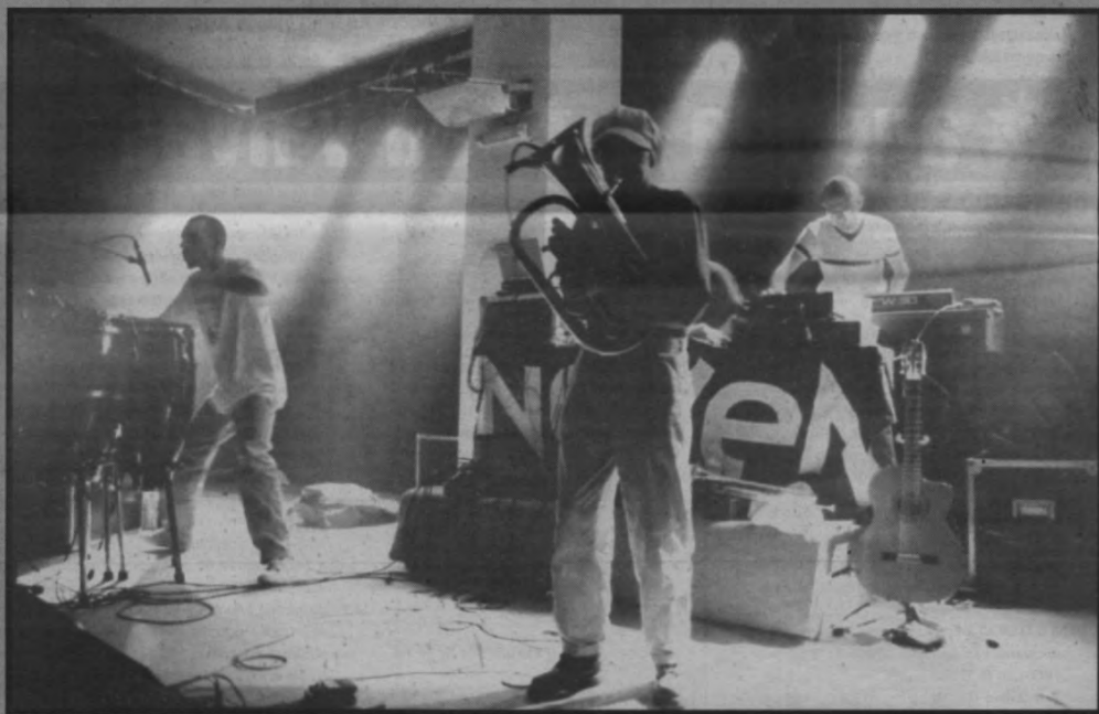
Techno, niet door nichten