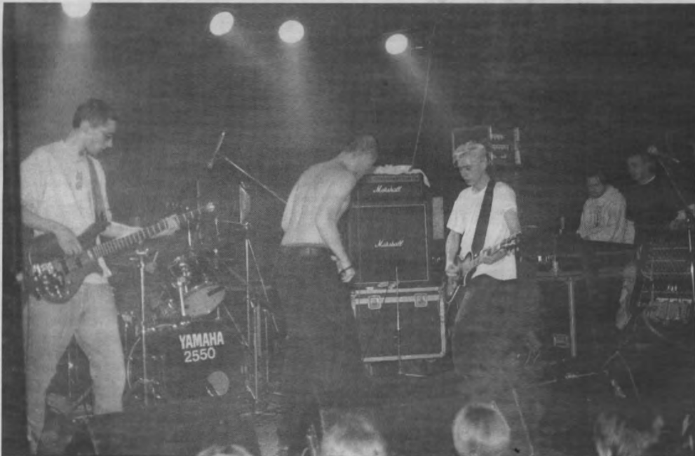
Ook The Gwyllions speelden het bloed uit hun lijf.