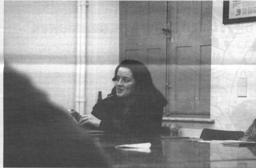
Is er nog plaats voor idealen? Rechtstudenten zetten de zaken recht.