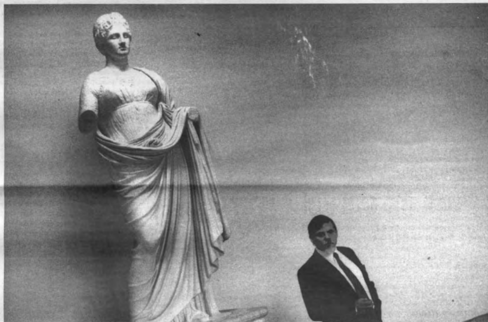
Zonder lange arm kom je er niet.

Herbots: «De rechtstudenten hebben een avond georganiseerd in De Somer met een