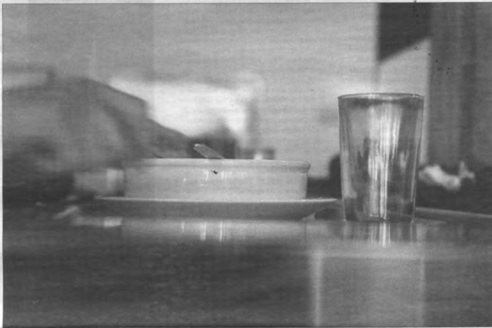
Zoals het eten op kot smaakt, smaakt het nergens.