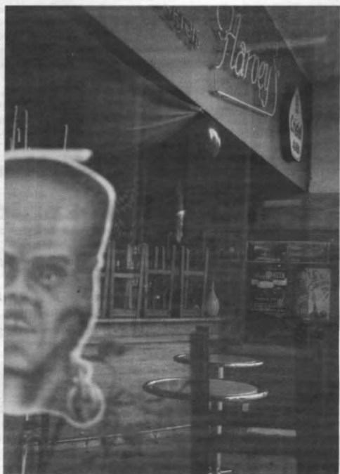
Ik moet er toch geen Kanttekening bij maken?

De fakbar van filosofie is gelegen op het Smetsplein (tussen de Holiday Inn, ThaiHouse en het stedelijk zwembad) en kan enkel op donderdag bezocht worden.