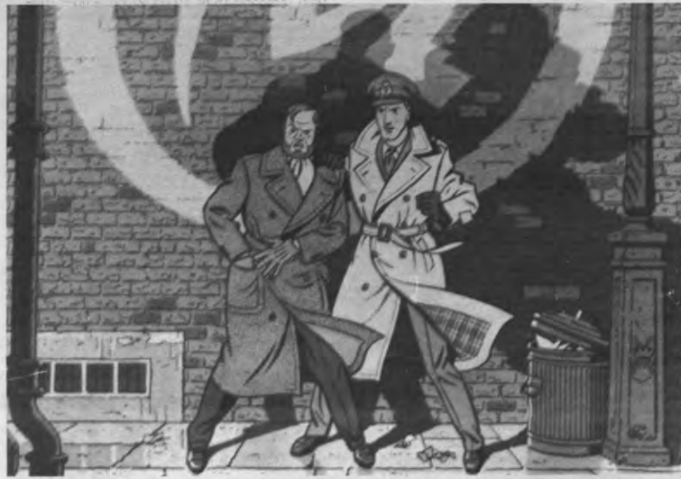
Helden kunnen er ook gewoon uitzien: als een professor bijvoorbeeld of als een sympathieke legerofficier. In strips is alles mogelijk.