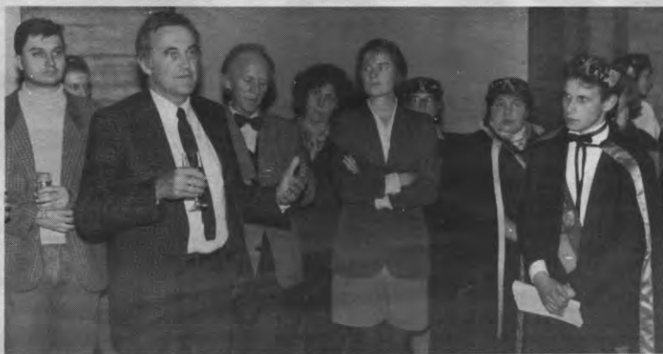
Mosaic is geweest, Mosaic was goed. Laat de sessies dan niet je van het geweest zijn, de recepties en fuiven maakten alles goed. En bovendien konden we nog eens goed lachen met die knappe Walen van Louvain-la-Neuve. Zij werden allemaal verplicht hun pet op te houden, zodat ze van tijd tot tijd konden rondgaan om hun volgende Europese rondje zelf te kunnen betalen. Het wordt een kroegentocht van Salamanca, Bologna, over Groningen tot aan de Vrije Universiteit van Brussel, de vier voornaamste universiteiten van de Coimbra-groep.

NVDR: U vraagt wel erg veel van ons: Veto wordt op zondagnacht in elkaar gestoken, gaat maandagmorgen naar de drukker, ligt maandagavond op de meeste verdeelpunten en wordt ook op maandagavond naar de abonnees verstuurd. We kunnen natuurlijk eens proberen speciaal voor u één exemplaar een week op voorhand te drukken, maar dan staat er misschien ook geen nieuws in.