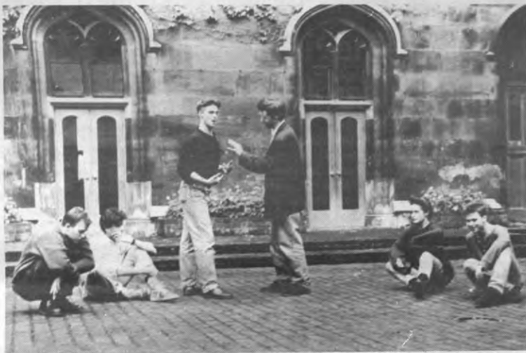
PIERRE - Friends, Belgians, countrymen, lend me your ear: ieder year organiseert de afdeling Engelse literatuur een toneelvoorstelling. In de pit van de winter koos men daarom voor "A midsummer night's dream" van die ouwe Sjetskijer. Het steeds wisselend gezelschap van student-akteurs zorgt meestal voor een erg hedendaagse interpretatie van zijn klassiekers. Vooral Parijs-Roubaix belooft very spannend te worden. In Leuven vind de première plaats op the continent. Komt seen, komt kijken, in Auditorium Minnepoort, Koning Albertlaan 52 op dinsdag 5 en Woensdag 6 december om 20 u. Kaarten zijn te verkrijgen bij Info en Onthaal, Old Markt 13.