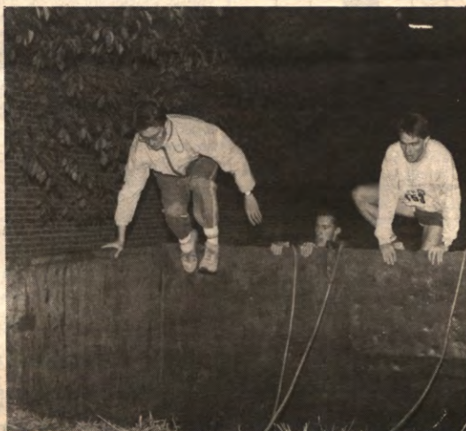
Opzij. Opzij. Opzij. Deze heren ontsnappen via de muurtjes uit het herentollet. Zij kregen het slot niet meer open.