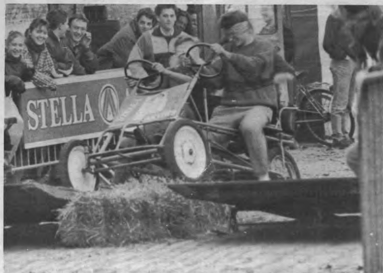
Veto's spelletjestip: Rij eens geblinddoekt met een go-cart over een wip. Wij doen het elke dag. U ook?