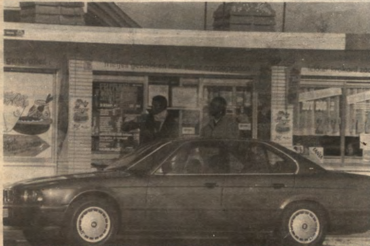
BLANK of zwart, geel of paranormaal, frieten lusten we allemaal. Sommigen lusten echter ook migranten en liefst nog rauw. Op pagina 3 de rauwe werkelijkheid over migrantennota's en andere redaktioneels.

STUDENTENWEEKBLAD VAN DE LEUVENSE OVERKOEPELENDE KRINGORGANISATIE - JAARGANG 16, 1989-1990, NUMMER 10, MAANDAG 27 NOVEMBER 1989