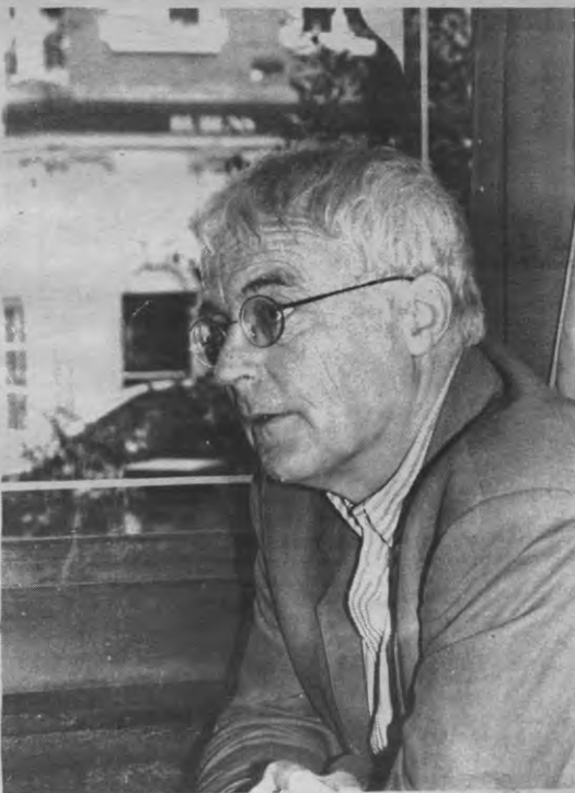
«Als je niet geïnteresseerd bent in de vorm, dan moet je niet gaan dichten.»

«In onze uitwerking van wetenschappelijke uitspraken zijn er natuurlijk heel veel spelregels die je moet volgen, en die respecteer ik ook dagelijks. Zoiets doe je niet in de poëzie. Daar laat je het bij de speculatie. Maar als dat puur subjektieve rimram was, dan zou toch niemand daar iets in zien. Bij sommige mensen trekt poëzie de ogen open. Dat is toch al een begin van intersubjektieve mededeel-