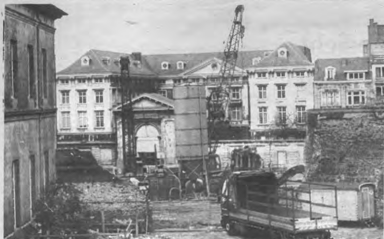
Niet enkel buiten, maar ook in de Valk worden hamer en boor gehanteerd.