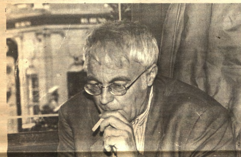
KOPLAMP - De jongste PC Hooftprijswinnaar mag dan al besloten hebben in Nederland interviews te weigeren, "want het zijn allemaal huffers," voor Veto bleek hij best beschikbaar. Over de wetenschappelijkheid van poëzie, pagina 4.