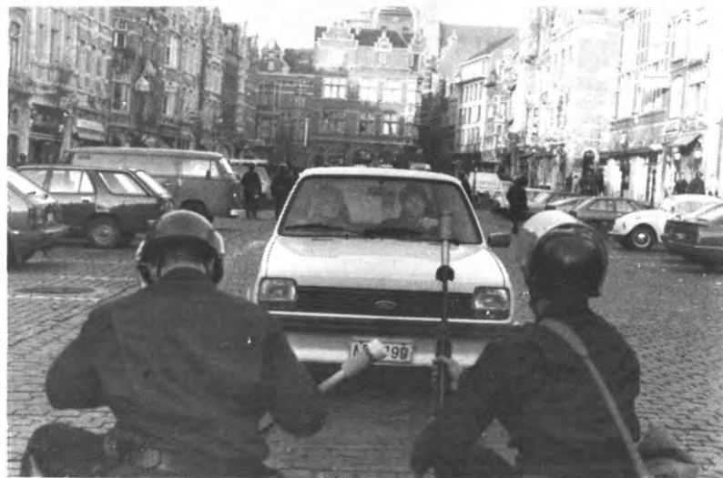
Zouden die mannen niet weten waar de C&A is?