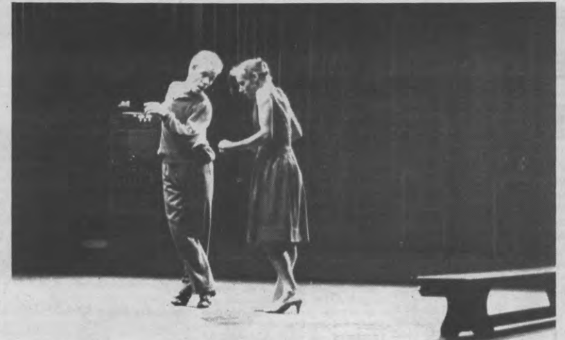
Mag ik deze dans van U? Daar moet ik toch even over nadenken.

Wie houdt van analyseren zal wel merken dat er in drie "fazen" gedanst wordt. Er zijn de echte soli (vaak een van de dansers zover mogelijk van de andere, al dan niet geobserveerd door die andere), parallelle duo's (nog steeds op een afstand) en tenslotte echte pas de deux . Ook de muziek speelt hierin een rol: je hoort eerst een wals van Schubert, en daarna de meer moderne bewerking ervan door Webern. Ook met de belichting wordt bijna wiskundig gespeeld: de dansers bedienen zelf geluid en belichting,