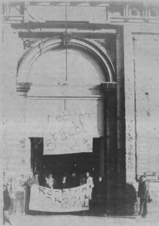
Alternatief piketteren bij de Rechten. In plaats van kettingen te leggen hielden ze dan maar een ekstra openbare pleitoeefening.

— getuige X Hergroepering in het Pauskollege,