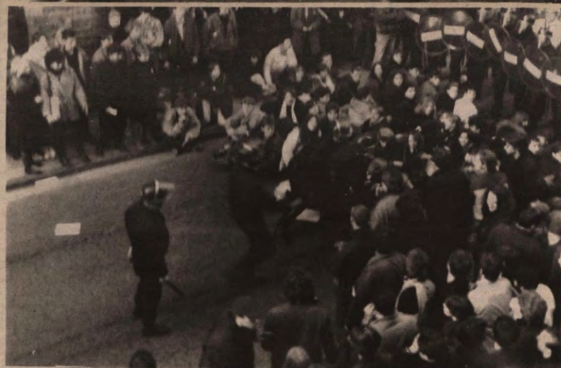
NA TWEE DAGEN staken en 21 uur bezetting van het rektorat kwamen uiteindelijk franstalige rijkswachters de boel opruimen.