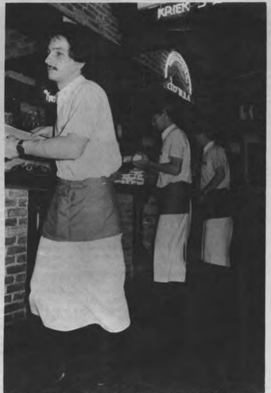
Vier op 'n rij is moeilijk te spelen in sommige kafees.

De baas weet dat er voor elke student die hij ontslaat tien anderen klaar staan om zijn plaats in te nemen. Tien studenten die ofwel naïef genoeg zijn om met zich te laten sellen, of die gewoon het geld nodig hebben en bewust het risico nemen. Risiko's zijn er wel degelijk. Zo ben je als je niet ingeschreven bent niet gedekt tegen