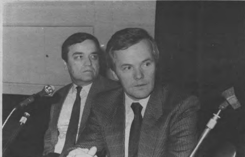
Poppenkast is geen spek naar de bek van deze mannen. Alleen voor het versjacheren van Starfighters zijn ze nog warm te krijgen.

4. Massale troepenbewegingen zijn niet toegestaan. Je mag dus maar drie rijkswachters tegelijk verplaatsen, het waterkanon kan niet door de nauwe