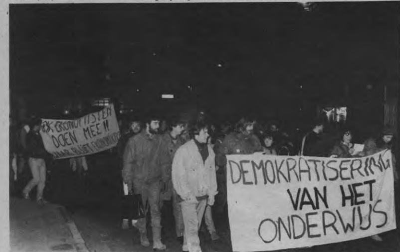
BETOGING MAANDAG 1 DECEMBER: voor het eerst sinds 18 jaar weer een betoging in Leuven waarop veel volk is en waar ook het grootste deel van de studenten achter staat.