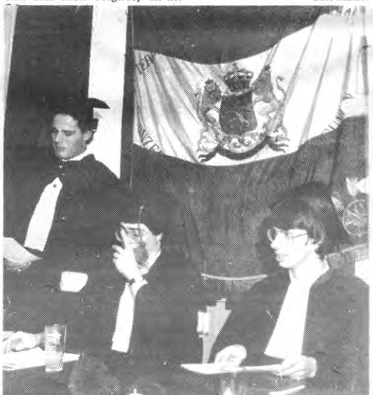
Hollandia Lovaniensis: een 'aparte' studentenklub.

Agenda en Ad Valvas: ten laatste maandag voor verschijnen om 14.00 u op het redaktieadres. Redaktievergadering: iedere vrijdagmiddag om 15.00 u.