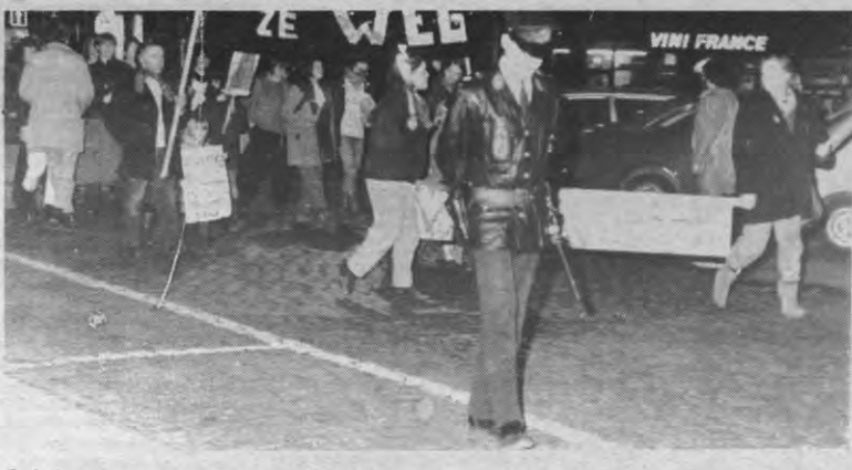
POTTEN- EN PANNENBETOGING — Ondanks de frustratie en hopeloosheid, verzamelden zich verleden maandag toch nog een kleine tweehonderd mensen om hun afkeer van die kernraketten met potten en pannen te tonen. Dat niet iedereen daar mee opgezet is en soms wel overgaat tot kleinzielige akties, bleek ook deze keer weer: toen de kletterende stoet ter hoogte van huis nummer 10 op het Ladeuzeplein kwam, werd er van de tweede verdieping een emmer water over de betogers gegoid.