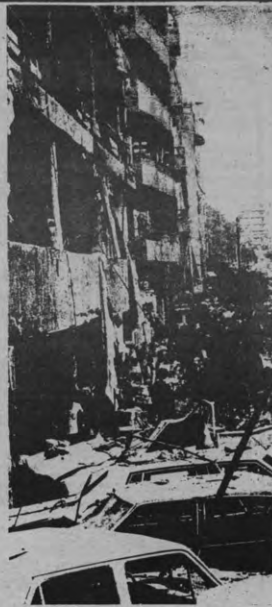
Beiroet; de stad na een verwoestende oorlog.