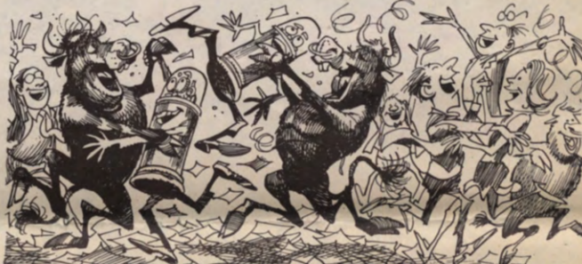
De vreugde-uitingen bij het vernemen dat de Alma-maaltijdprijzen in '79 niet zullen verhogen.

Op dezelfde vergadering werd een discussie aangegaan omtrent de oprichting van een Culturele Sektor aan onze unif, dit naar aanleiding van de in het oog springende begroting van Kultuurraad. Meer rond deze problematiek las je in Veto 8. Kultuur-