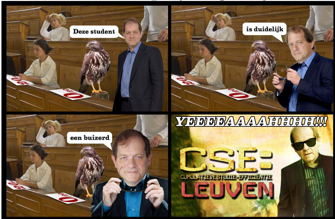
Heb 61 studiepunten moeten opnemen dit academiejaar